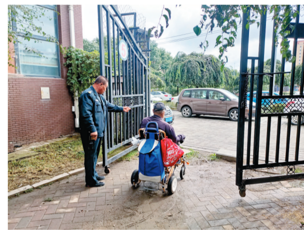
加入“红心物业”联盟后,物业服务水平直线上升。图为“五星物业”万龙物业工作人员特意给小区行动不便的居民开大门让其进出。