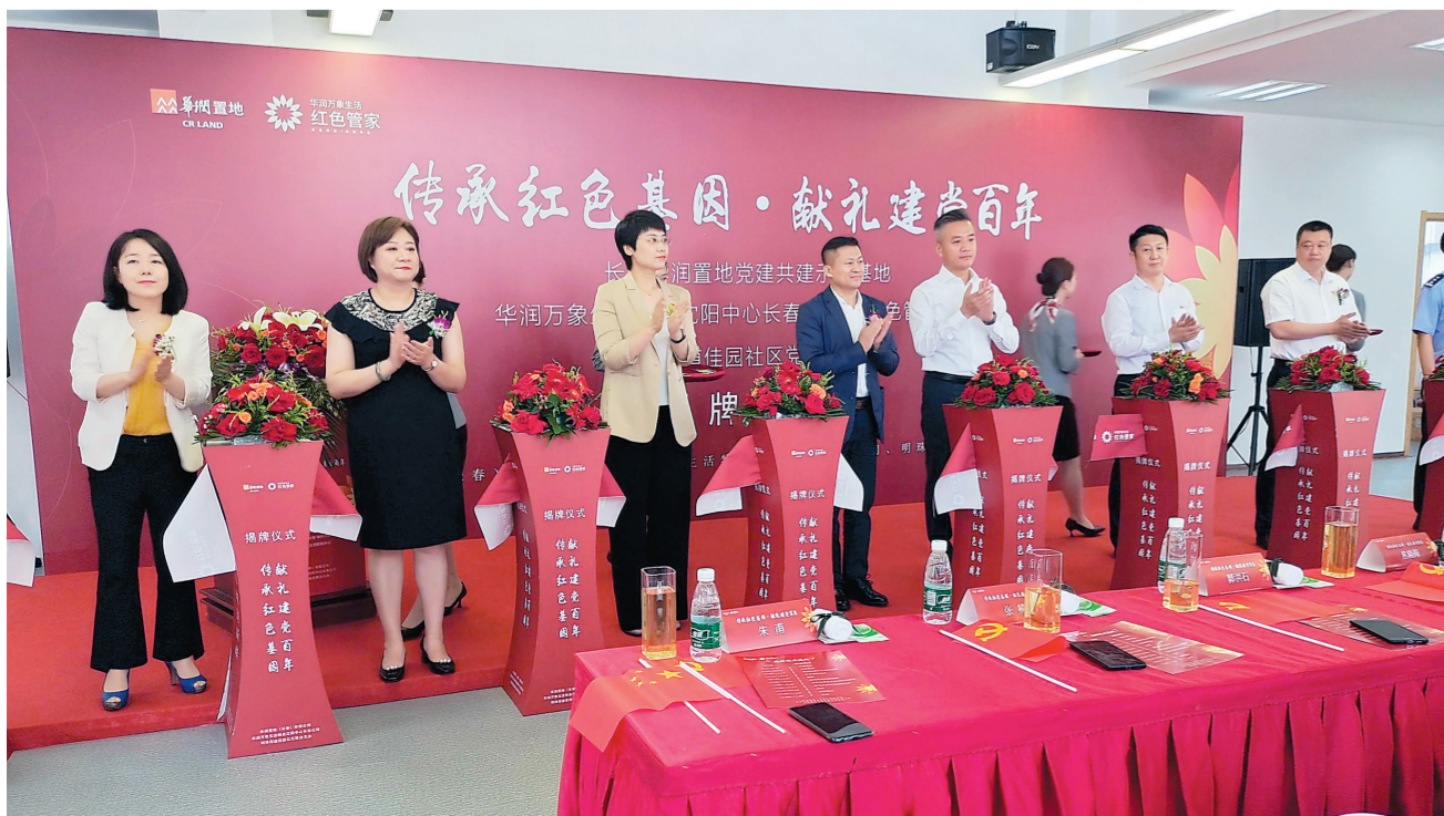
在佳园社区华润橡树湾小区,“红色管家”暨明珠街道佳园社区党群服务站(橡树湾站)揭牌仪式启动。

疑惑我来解,烦恼我来排。深度挖掘新闻细节,全面剖析事实真相,为您澄清谬误。扫一扫,加入我们,私信我们,关注我们身边的社会热点问题。