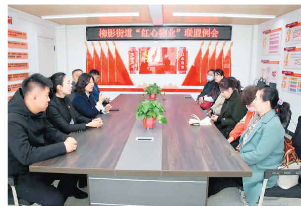
柳影街道“红心物业”联盟成立后,定期召开例会推进工作。

街道佳园社区党群服务站(橡树湾站)的揭牌仪式在华润橡树湾小区党建示范基地启动后,小区居民乐开了花。“本来我们小区物业服务就挺好,打造了‘红色物业’、有了‘红色管家’后,我们小区更是大变样,不仅环境卫生越来越好了,小区绿地多了凉亭,墙上有了宣传画,居民有啥难题物业和社区都给帮忙解决。”据介绍,佳园社区联合华润置地(长春)分公司共同打造佳园社区红色阵地建设,涵盖了“红色管家”议事厅、居民活动多功能室、会议室、党员联络站以及“和事佬”调解室等功能区,形成以党建引领,借“管家”联动、靠党员凝聚、让居民共享的基础治理新格局,为近3000户居民提供家门口的党群服务站,让党员群众感受到“家”的温暖,产生出“家”情怀。