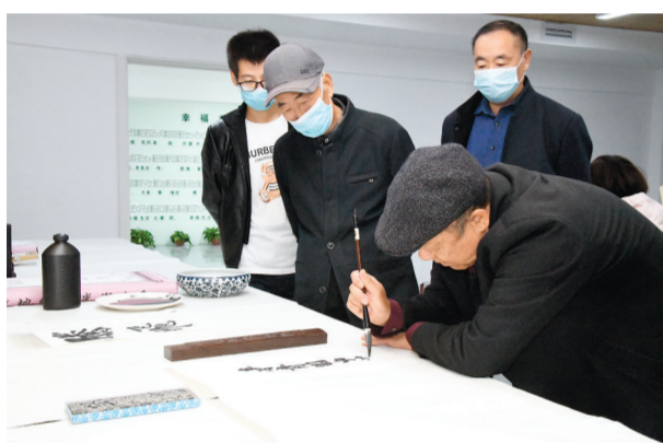
为更好推进“红心物业”联盟工作,柳影街道打造了1100平方米的“红心物业”联盟阵地,除了商讨物业治理,这里也为居民设置了活动区域。