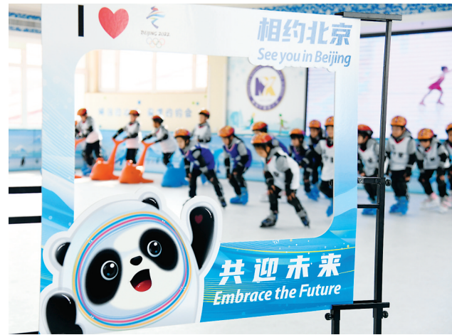
1月11日,青岛市宁夏路小学的同学们在体育课上练习滑冰。随着北京冬奥会临近,山东省青岛市众多学校开设趣味性、参与度高的冰雪项目体育课,让孩子们了解并喜欢上冰雪运动,感受冰雪运动的魅力。

俄罗斯政治信息中心主任穆欣说,美国需要与俄达成安全协议,但不可能像俄方希望的那样尽快给出明确答复,因为那意味着美国需要放弃舆论过渡期而立即公开地“屈服于”俄方要求。(参与记者:邓仙来)(新华社莫斯科1月11日电)