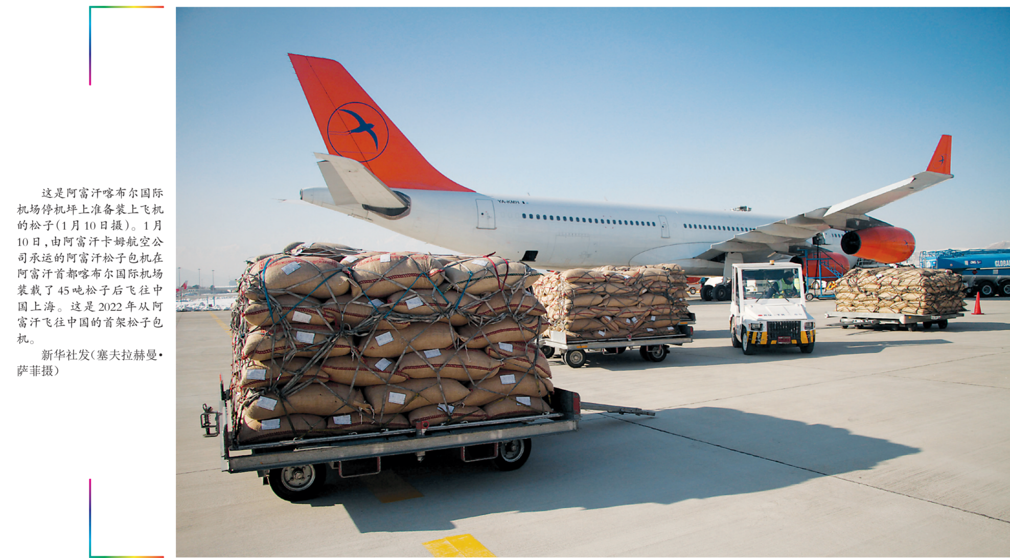
这是阿富汗喀布尔国际机场停机坪上准备装上飞机的松子(1月10日摄)。1月10日,由阿富汗卡姆航空公司承运的阿富汗松子包机在阿富汗首都喀布尔国际机场搭载了45吨松子后飞往中国上海。这是2022年从阿富汗飞往中国的首架松子包机。