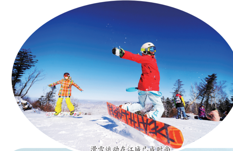
滑雪运动在江城已成时尚

巩固社会安定局面。毫不放松抓好常态化疫情防控，持续完善应急体系建设，筑牢食品药品安全防线，坚决遏制重特大安全事故发生。依法解决群众合理诉求，推进扫黑除恶常态化，持续巩固拓展平安江城建设成果。