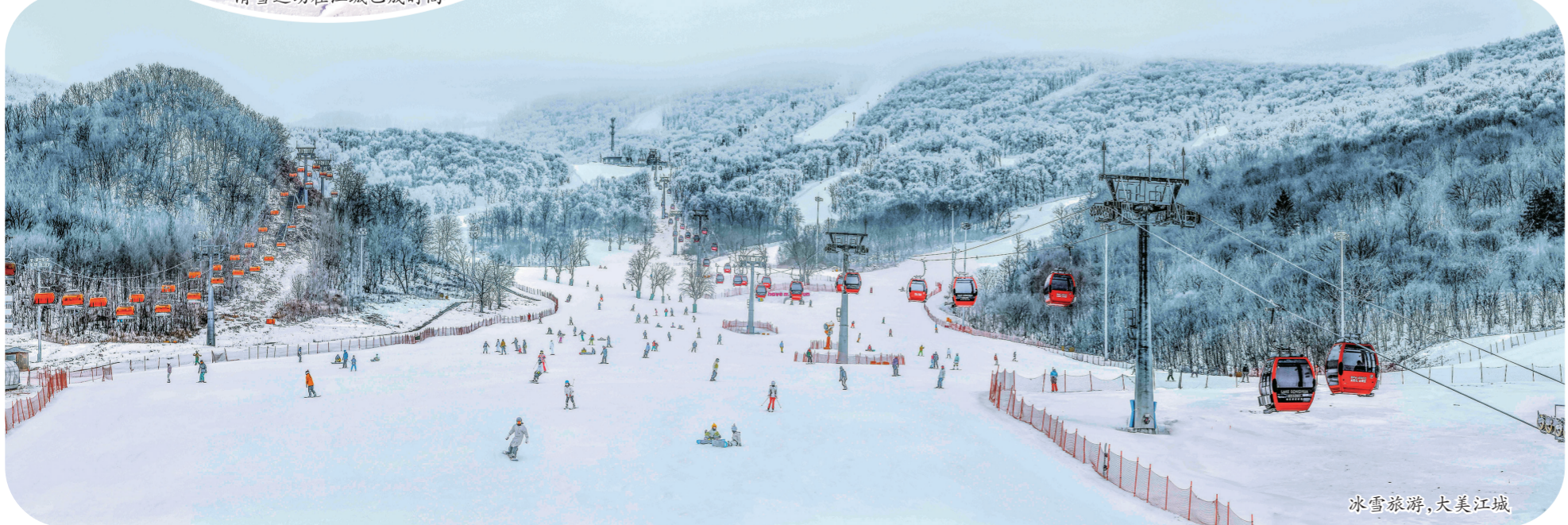
冰雪旅游，大美江城