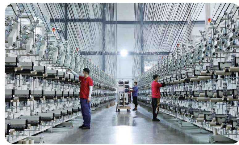
吉林化纤集团员工正在对刚刚开车的碳化线束外观进行细致检查

中新食品区、冰雪试验区等5大开发区发展能级，落位项目6平方公里，完成投资240亿元以上。