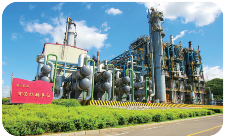
吉林石化70万吨/年乙烯装置(资料图片)

锲而不舍加强政府自身建设，扎实开展“两学一做”学习教育、“不忘初心、牢记使命”主题教育和党史学习教育，严格落实全面从严治党主体责任。累计办理市人大代表建议271件、市政协委员提案970件，提请市人大审议地方性法规草案10部，法治政府、廉洁政府、服务型政府建设水平得到全面提升。