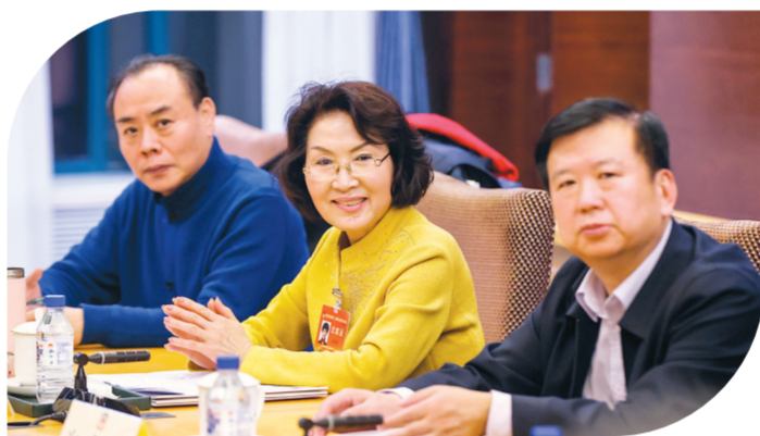
▲分组讨论中,委员们结合自身工作,积极建言献策。