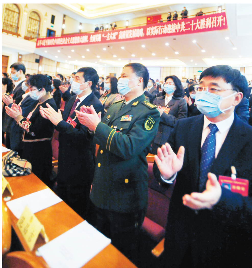
1月25日,省政协十二届五次次会议在长春胜利闭幕。图为大会会场。

江泽林强调,要深入领会“两个确立”的决定性意义,进一步加强思想政治引领。弘扬伟大建党精神,传承百年奋斗经验,学深悟透习近平新时代中国特色社会主义思想,学习贯彻习近平总书记视察吉林重要讲话重要指示精神,增强“四个意识”、坚定“四个自信”、坚决拥护“两个确立”、坚决做到“两个维护”。全面贯彻习近平总书记关于加强和改进人民政协工作的重要思想,努力成为坚持和加强党对各项工作领导的重要阵地、用党的创新理论团结教育引导各族各界代表人士的重要平台。(下转第三版)