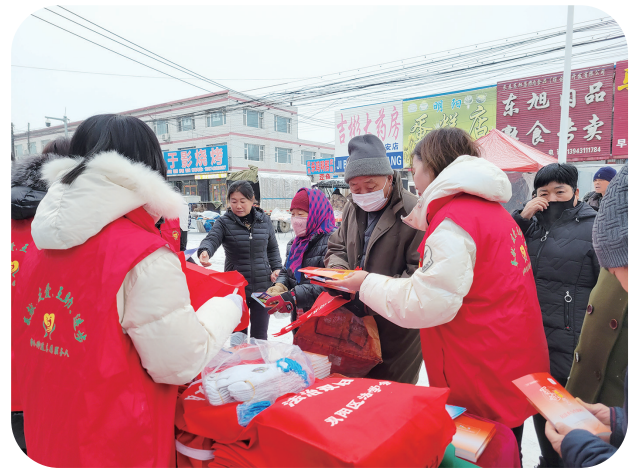
大集里的“普法摊位”

民实践活动的一个缩影。 民生无小事，枝叶总关情。 自吉林省司法厅开展“十百千万”为民实践活动以来，统筹推进律师、公证、法律援助、司法鉴定、仲裁、司法所、人民调解、行政复议应诉、国家统一法律职业资格证书等方面工作，取得显著成效。 为了使人民群众获得感更加充实、幸福感更可持续、安全感更有保障，全省司法行政系统用真感情、下实功夫，切实解决群众遇到的难题。深入开展“服务保障再深入、为民实践再提升”专项行动，制定了提升12348法律服务热线质量、开展公益法律服务免费咨询活动等13项便民利民措施，以点带面推进系统为民实践活动的深入开展，受到社会各界和群众好评。 为民办事，普法先行。 2021年11月30日，吉林省司法厅联合省委宣传部等15个省直部门共同举办了吉林省“宪法宣传周”启动仪式暨主场活动，在“宪法宣传周”活动期间，全省共计开展普法讲座1860余场次，宪法宣传活动5100余次，印发法治宣传资料135万余份。