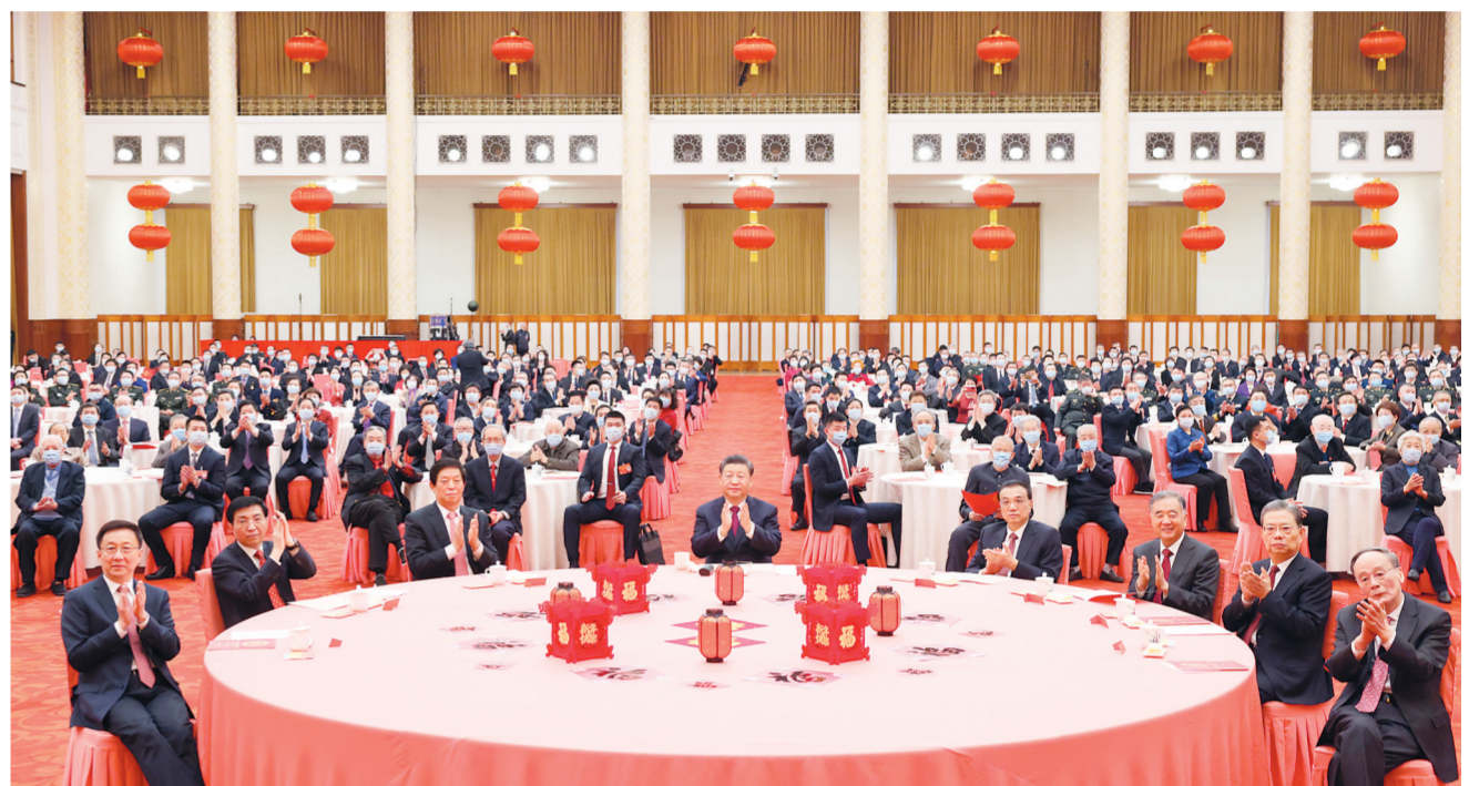
1月30日，中共中央、国务院在北京人民大会堂举行2022年春节团拜会。党和国家领导人习近平、李克强、栗战书、汪洋、王沪宁、赵乐际、韩正、王岐山等同首都各界人士欢聚一堂，共迎新春。

新华社北京1月30日电 中共中央、国务院30日上午在人民大会堂举行2022年春节团拜会。中共中央总书记、国家主席、中央军委主席习近平发表讲话，代表党中央、国务院，向全国各族人民，向香港特别行政区同胞、澳门特别行政区同胞、台湾同胞和海外侨胞拜年。(讲话全文见第二版) 习近平强调，一百年来，党和人民取得的一