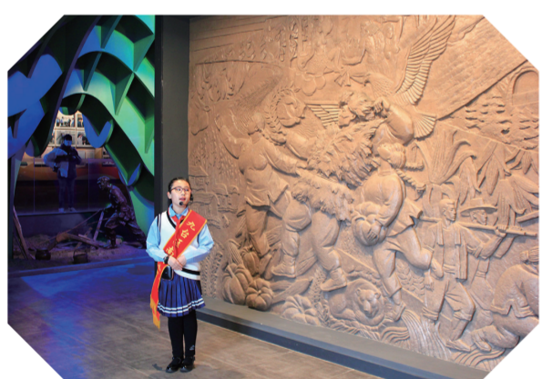
红领巾宣讲员。(“三下江南”战役纪念馆)

广泛搜集各领域的生动实践案例,用接地气的语言,精准找到理论与群众的对接点,通过讲故事、讲案例的方式在解决实际问题中传播理论,让群众从中受益。为避免出现宣讲员“讲完就走”、群众“听完就忘”的问题,九台区还以问卷调查、群众座谈、网络留言等形式搜集群众有关理论产品的反馈意见,综合分析搜集的意见建议,通过信息反馈,及时调整“口味”,优化宣讲方案、内容、形式,让宣讲更接地气、更聚人气。