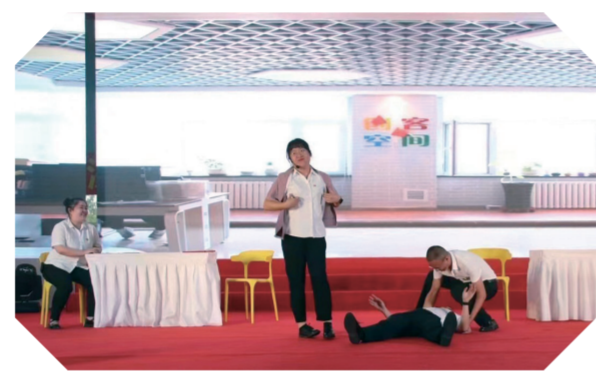
原创小品《我要去演讲》。

九台区充分发挥理论转换厨房的作用,制作出更适合百姓口味的“农家菜”,把理论知识编辑成脍炙人口的快板书,演绎成群众喜闻乐见的二人转、三句半、小品等,让理论融入艺术作品中,使宣讲更“接地气”,在轻松愉悦的氛围中教育群众,增强了宣讲对群众的吸引力。同时,开展“文艺轻骑兵志愿服务一线行”活动,演出原