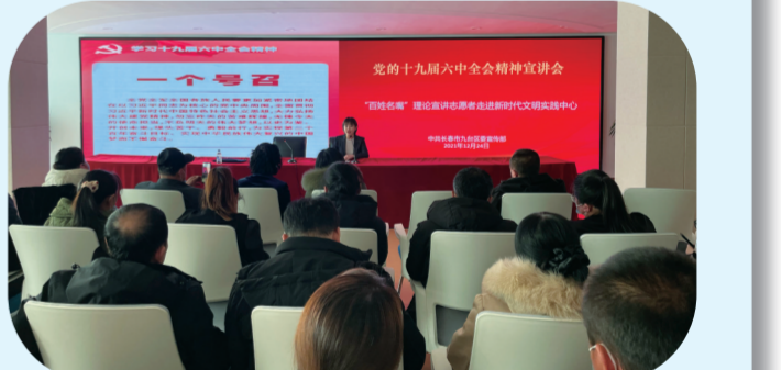
“百姓名嘴”理论宣讲志愿者走进新时代文明实践中心解读全会精神。