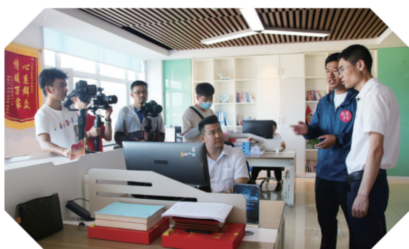
长春市九台区“理论转换厨房”正在策划拍摄理论微视频。

建立联动协同机制,提高“厨房”品位。专家、学者、教师等负责内容建设,根据群众所需,提供具有理论深度的宣讲稿;文艺工作者和文艺志愿者负责将理论创作成土味讲稿、文艺作品、微视频剧本等;宣讲员、百姓名嘴、文明实践骨干等在线下进行宣讲或由视频制作志愿者制作成微视频在线上传播,整个过程由区委宣传部负责审核把关。