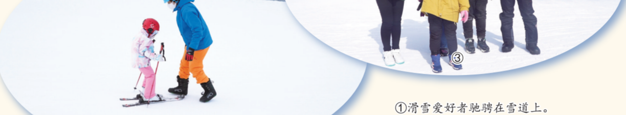
①滑雪爱好者驰骋在雪道上。②父亲传授女儿滑雪技巧。③祝福北京冬奥会圆满成功。