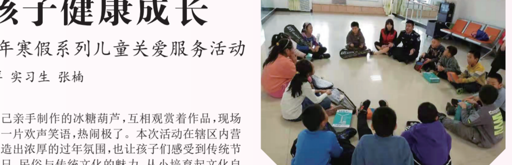
与孩子共同探讨知法懂法的重要性。

针对春运期间老人、小孩、孕妇等特殊旅客，提供爱心毛毯借用服务，为轮椅旅客提供“车门到车”爱心陪护，为无陪儿童提供“无陪之家”休息室，陪伴小朋友度过候机时间。积极与万达酒店沟通，增加旅客宾馆发车车次，减少旅客等候时间。同时，为进一步营造欢乐祥和的春节氛围，机场分公司启动春节期间亮化工作，在设计上，突出亮化精准性、品质感，在节点上，采用节能环保、结实耐用的新材料避免污染和光干扰，让旅客在回家的旅途中感受到浓浓的年味。