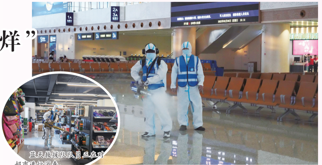
对长白山站进行全面消毒。

客人营造安全舒适的入住环境，长白山蓝天救援队对酒店进行了全方位消杀，为节后人们的健康及安全提供了坚实的保障。