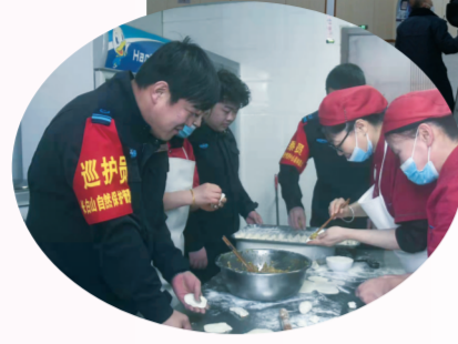
巡护队员们在保护站包饺子，过新年。

平平安安。尤其是我们站在新年过后，就被搬到新楼了，这里留下了我们许多故事，期待虎年我们的工作能更上一层楼。” 上午12时30分，记者来到了长白山北景区温泉广场。这里的工作人员跟平时一样，在工作岗位上一如既往地游客服务。景区管理部副经理姜琳告诉记者：“今天除夕，员工们都坚守在自己的岗位上，春节期间，我们依然要做好疫情防控，安全防火排查等工作。为了让五湖四海游客宾至如归，过一个有意义的春节，我们将做好各项服务工作。同时也祝广大游客朋友们，新的一年身体健康，阖家欢乐。” 14时30分左右，记者在长白山北景区温泉广场，崭新的车站迎来了它的第一个春节。长白山北景区的党委书记李洪伟正带领大家挂起红灯笼，使候车室充满了红红火火的节日气氛。为了保障春节期间旅客能够有序顺畅地出行，他们坚守在岗位上。“您好，