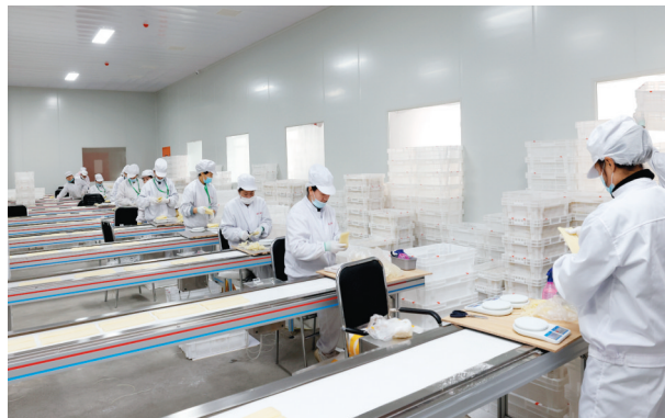
图为已经投入生产的韩香汇食品有限公司车间。

“情系于民爱百姓，公仆之心钦可嘉”“亲商务实今朝见，服务高素质好”。日前，吉林韩香汇食品有限公司送来的这两面锦旗，是对梅河口市高新区为企业贴心服务办实事的最高褒奖。