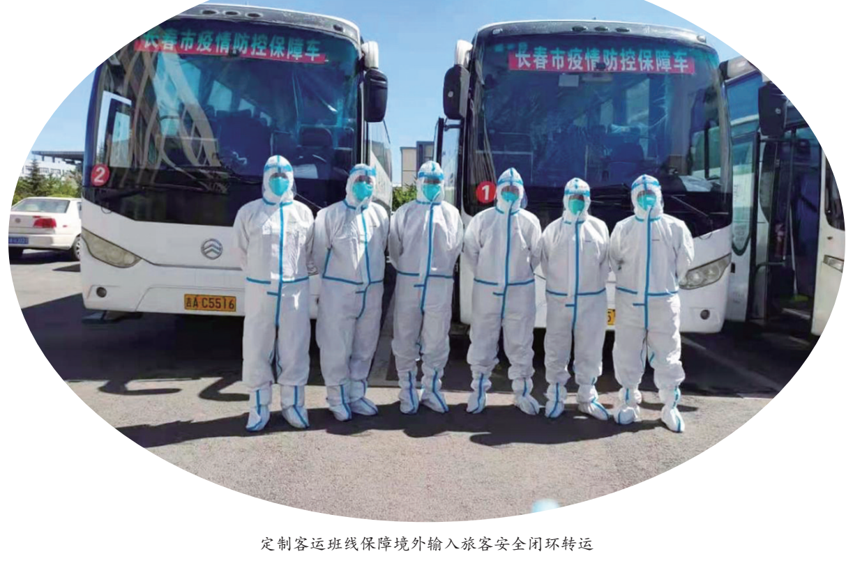
定制客运班线保障境外输入旅客安全闭环转运