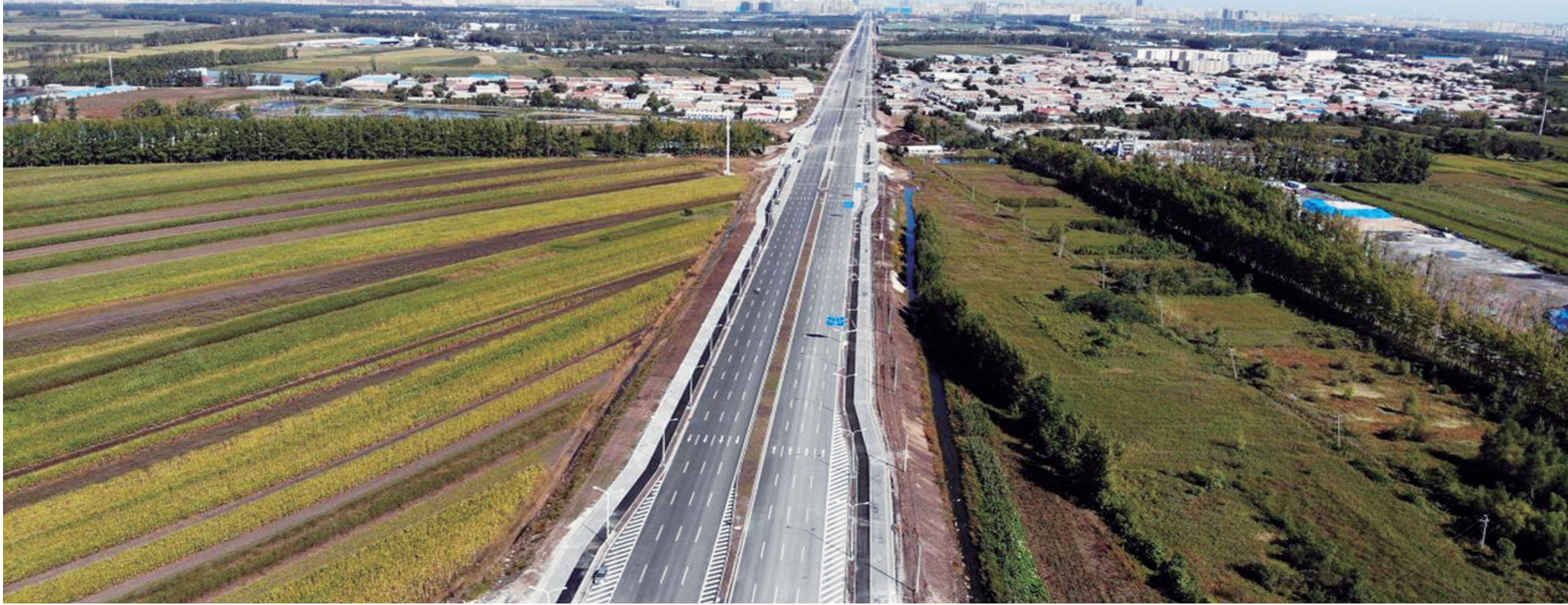
长伊公路建成通车

33.8公里,其中,净境内16.1公里、双阳境内17.7公里。长春至双阳公路续建项目今年计划投资4.7亿元,长春市交通运输局全力克服资金不到位困难,筹资、拆迁、施工共同推进,2021年计划投资4.7亿元,长春市交通运输局全力克服资金不到位困难,筹资、拆迁、施工共同推进,完成4.9亿元。