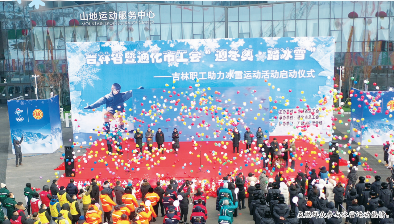
点赞群众参与冰雪运动热情。

“东风随春归，发我枝上花。”伴随着春天的脚步，“金”冬通化，一场接一场以冰雪为名的盛事、盛景仍在火热上演。 通化，正以推动冰雪运动为目标，将“冷资源”转化为“热产业”，掘金“冰雪经济”，在赏雪嬉冰的季节，与北京冬奥同频共振，不断与文旅、产业等元素碰撞出激烈火花，热情张开双臂，拥抱着四面八方的游客。 冰天雪地间，通化凭借得天独厚的冰雪资源优势，积极融入我省冰雪产业“一心、三廊、两区、两环线、多节点”的空间布局，以冰雪产业为支撑，冰雪旅游牵动发展，冰雪文化提升内涵，冰雪运动引领方向的蓝图布局，笃定而坚实，谱写出冰雪经济高质量发展的动人旋律。