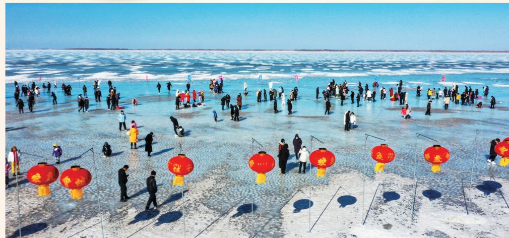
群众在“冰汤圆”天然冰雪景观游玩留念