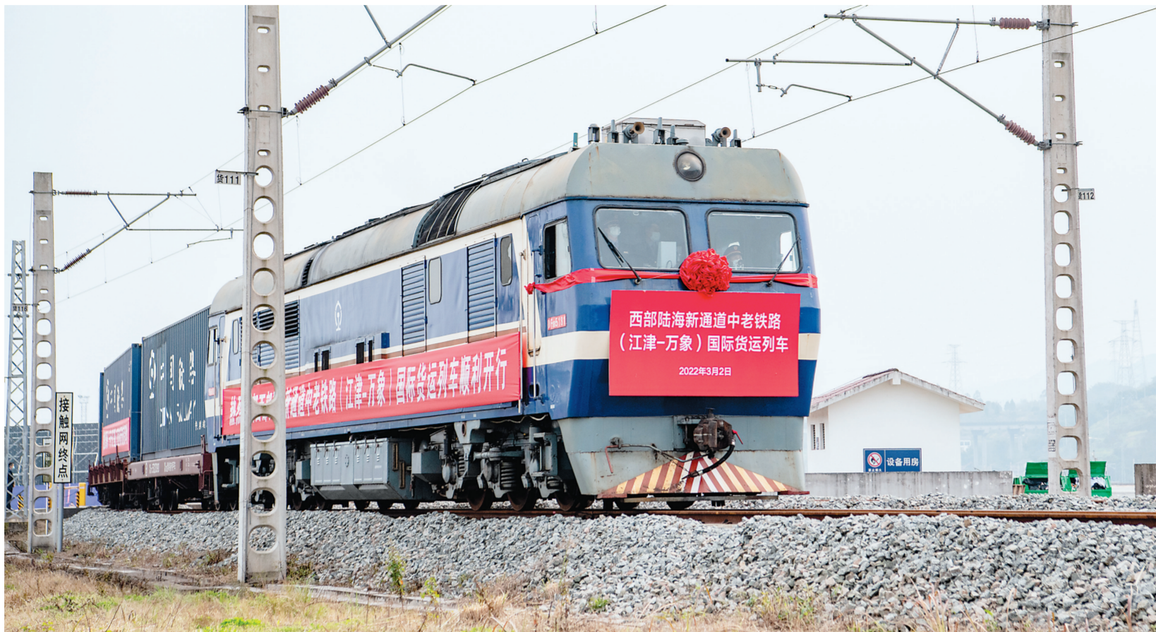
3月2日，中老铁路(江津-万象)国际货运首发列车从小南垭铁路物流中心驶出。当日，首趟陆海新通道中老铁路(江津-万象)国际货运列车在重庆江津路环物流园片区的小南垭铁路物流中心正式发车，共运载37个集装箱，货值约400万元，包括化工品、建筑材料、通用机械、日用百货等。

仪式上，中共中央政治局委员、北京市委书记、北京冬奥组委主席蔡奇发表热情致辞，强调将兑现“两个奥运、同样精彩”的承诺，举办一届简约、安全、精彩的残奥盛会。仪式还播放国际残奥委会主席安德鲁·帕森斯的视频致辞。 中央和国家机关有关部门、北京市、河北省和北京冬奥组委负责同志，火炬手、运动员、志愿者和社会各界代表等约400人参加。