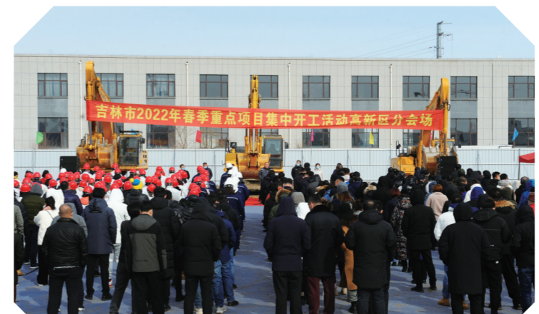
吉林高新区项目集中开工现场

2022年,吉林高新区将按照全省聚焦“两确保”奋进“一率先”工作目标,不断创新服务模式,提高审批效率,强化要素保障,以项目建设的新突破推动经济社会发展向更高质量迈进。