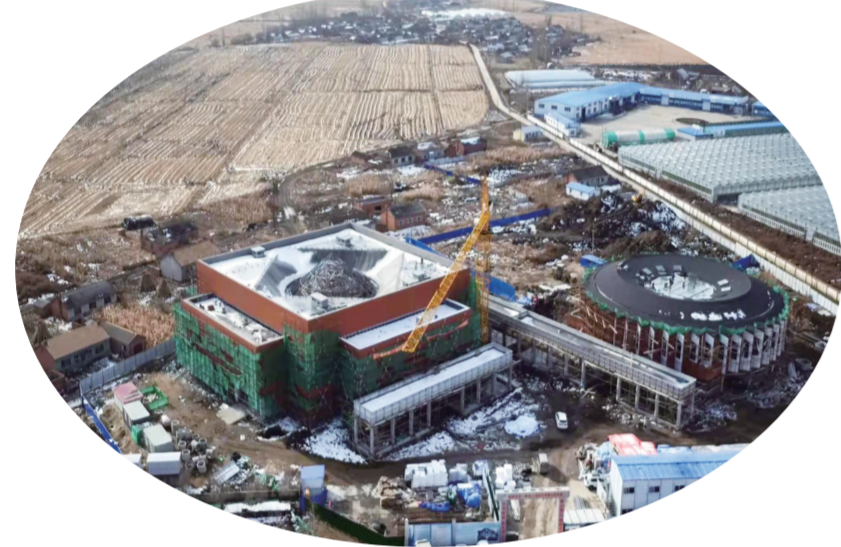
永吉县国家农村产业融合发展示范园项目现场

下一步,永吉县将把抓项目摆在突出位置,提前谋划,及早行动,主动作为。他们要进一步转变工作观念,克服一切不利因素,及时协调解决项目建设中遇到的各种难题,全力确保项目如期达产达效。