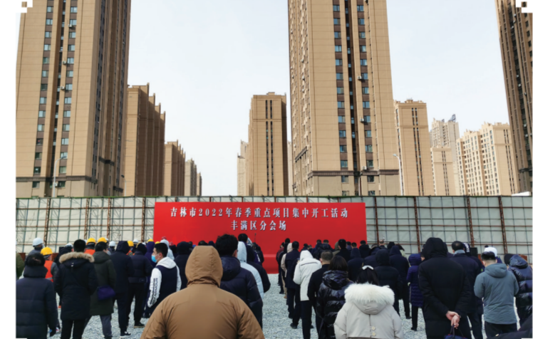
吉林市春季项目集中开工丰满分会场

2月28日,丰满区春季重点项目集中开工活动在中海寰宇天下商业综合体项目现场拉开帷幕,播响新春开局第一鼓,奏起高质量发展的“春之序曲”。开工仪式上,丰满区委主要领导通过音频连线向主会场汇报了全区春季项目集中开工情况。年初以来,该区累计开工5000万元以上项目20个,总投资90.3亿元,年度计划投资22.5亿元。其中,新开工项目4个,复工项目16个。一季度,全区预计完成投资4.75亿元,增长8%。全年计划实施5000万元以上项目32个,总投资175.4亿元,全年投资预计增长10%。下一步,丰满区将按照全省聚焦“两确保”奋进“一率先”工作目标,全面落实吉林市“四六四五”发展战略,大力实施“四区一化”发展战略,以起步即冲刺、开局即决战的奋斗姿态,实施区级领导专班包保推进机制,坚持“五化”工作方法,着力在招商引资、项目建设、营商环境等工作上下功夫,为打造产业高端、商旅宜居、人民幸福的现代化丰满奠定坚实基础。