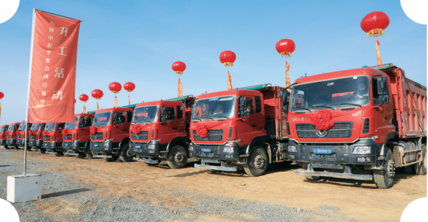
磐石市春季项目集中开工现场,卡车整齐排列

作为磐石市春季集中开工中的重点项目,金隅冀东新型建材产业园将按照“7+4”的规划,即7个新建项目、4个产业升级技术改造项目,打造集水泥制造、新型建材、生态环保、商品混凝土、现代物流等产业为一体的全产业链建材产品生产基地。产业园项目总投资30亿元,各项目全部达产后,预计年度工业总产值将达到24亿元,预计年上缴利税合计7.56亿元。