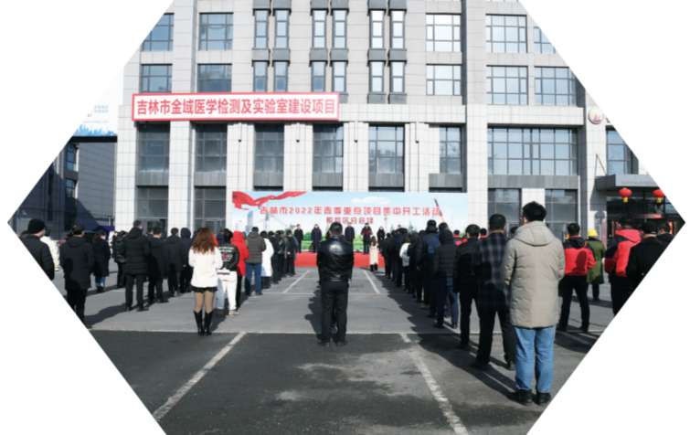
吉林市春季项目集中开工船营分会场

2022年,船营区将按照全省聚焦“两确保”奋进“一率先”工作目标,重点推进2022年保障性安居工程、东北师范大学船营实验学校、北京大学附属医院中东院区、福绥街小商品批发市场改造等新建项目开工建设。全年计划开工5000万元以上项目55个,总投资425亿元,当年计划完成投资46.8亿元。