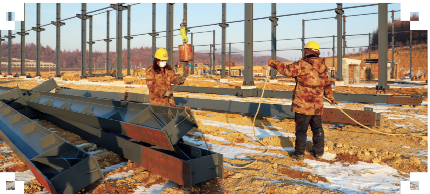
蛟河市黄松甸镇食用菌产业园物流园项目现场

作为蛟河市春季集中开工项目,黄松甸特色食用菌产业园物流园项目总投资1.3亿元。项目规划总用地5.6公顷,总建筑面积4.68万平方米,其中地上建筑单体18栋,包含共享车间、物流仓储、综合楼等。项目建成后,将整合黄松甸镇区位优势、资源优势和产业优势,促进一二三产业融合发展。项目运营达产后年收益预计1400万元,为200余人提供创业岗位,拉动2000人就业。