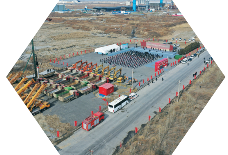
吉林市春季项目集中开工龙潭主会场远景

集中开工活动后,与会人员还实地踏查了吉林万邦达环保技术股份有限公司绿色循环经济资源综合利用、美思德(吉林)新材料有限公司4.5万吨/年有机胺系列产品等项目。