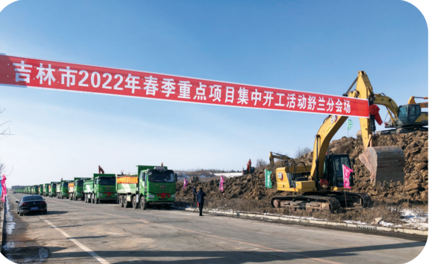
舒兰市春季项目集中开工现场

据了解,舒兰市依托地理、粮食、秸秆、种鹅、孵化、羽绒制品加工等发展优势,将白鹅产业列为十四五期间重点发展项目,实现将“大粮食”“大草棚”转化为“大肉库”“大绒仓”。