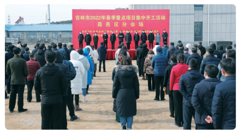
昌邑区在融通机电设备有限公司年产5000万套线缆项目现场举行2022年春季重点项目集中开工活动

据了解,昌邑区将完善招商引资重大项目推进工作机制,组建招商引资重大项目推进工作领导小组,把招商引资重大项目工作专班,在责任落实、服务保障、优化营商环境上下功夫,全面推进项目建设,以项目建设的新突破推动昌邑区经济社会高质量发展。