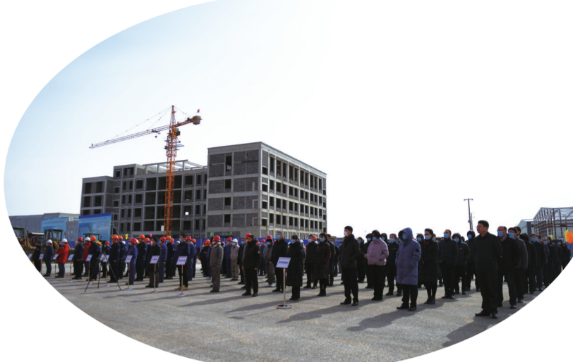
吉林经开区春季集中开工现场

记者在吉林化纤年产6万吨碳纤维项目现场看到,土地平整工作正在有序推进。据了解,该项目总投资