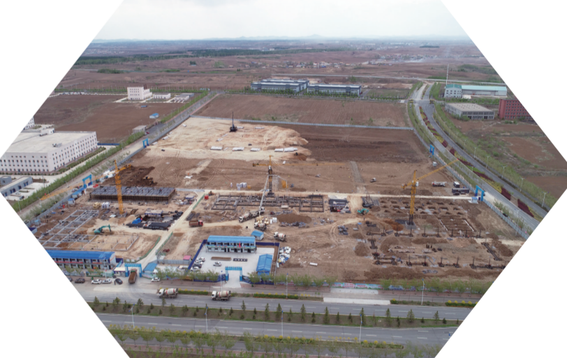
中新食品区中草药产业园项目现场

活动当天,中新食品区共集中开工5000万元以上项目9个,总投资39.4亿元,年度计划投资9.5亿元。年初以来,中新食品区累计开工5000万元以上项目10个,总投资41.6亿元,年度计划投资10.1亿元,中新食品区预计完成投资1.12亿元,增长20%。今年,中新食品区计划实施5000万元以上项目总投资145.8亿元,全年投资预计增长26.7%。