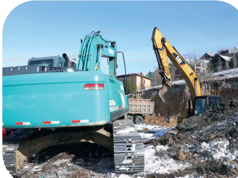
吉林市冰雪试验区北大湖国家雪上训练基地项目施工现场

冰雪试验区把把服务企业作为经济发展的关键点,努力打造便利企业的服务体系,营造透明高效的政务环境;继续深化“放管服”改革,持续落实减税降费政策,帮助企业解决资金问题,把支持落在流程中,体现在工作中,全力推动服务企业能力持续提升。