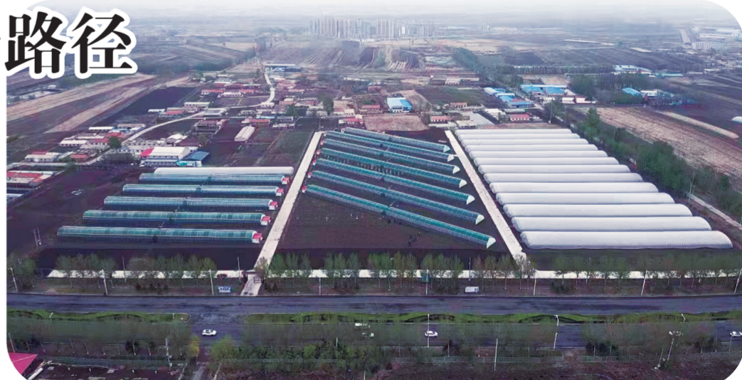
宽城区兰家镇姜家村的吉林省吉林绿色农业科技有限公司日光温室生产园区

马家村采摘园是以农夫水果采摘园、科发采摘园、铭隆采摘园为核心，形成采摘草莓、葡萄、桃及各种蔬菜的模式，并形成产业集聚。