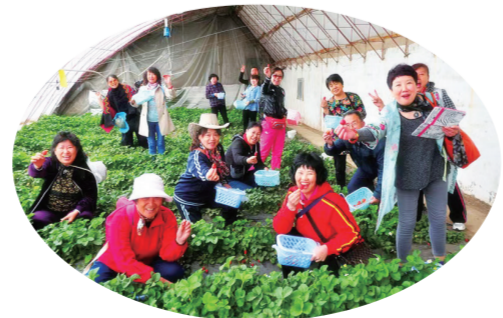
市民到吉林省荣发生态农业开发有限公司体验草莓采摘

荣发生态农业开发有限公司是以生态旅游为主，生产有机果蔬，建成集种苗培育、观光采摘、科普教育、餐饮住宿体验于一体的现代都市农业园区，通过聘请吉林农业大学、辽宁果蔬研究所为技术依托单位，形成产、学、研紧密结合的体系，并完成了“尚谷源”商标注册。