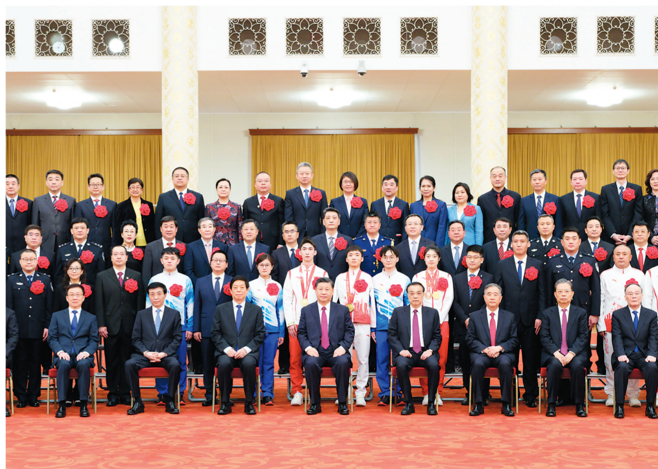
4月8日,北京冬奥会、冬残奥会总结表彰大会在北京人民大会堂隆重举行。会前,习近平等会见北京冬奥会、冬残奥会突出贡献集体代表、突出贡献个人和中国体育代表团成员,并同大家合影留念。

新华社北京4月8日电 北京冬奥会、冬残奥会总结表彰大会8日上午在人民大会堂隆重举行。中共中央总书记、国家主席、中央军委主席习近平出席大会并发表重要讲话(讲话全文见