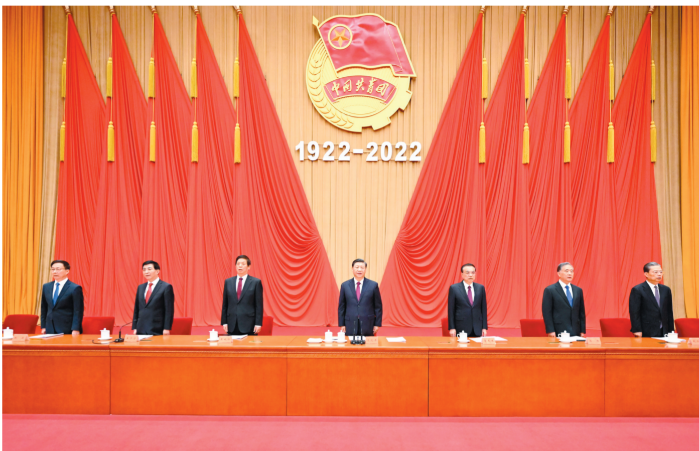
5月10日,庆祝中国共产主义青年团成立100周年大会在北京人民大会堂隆重举行。习近平、李克强、栗战书、汪洋、王沪宁、赵乐际、韩正等出席大会。新华社记者 李学仁 摄

新华社北京5月10日电 庆祝中国共产主义青年团成立100周年大会10日上午在北京人民大会堂隆重举行。中共中央总书记、国家主席、中央军委主席习近平在会上发表重要讲话强调,青春孕育无限希望,青年创造美好明天。新时代的中国青年,生逢其时,重任在肩,施展才干