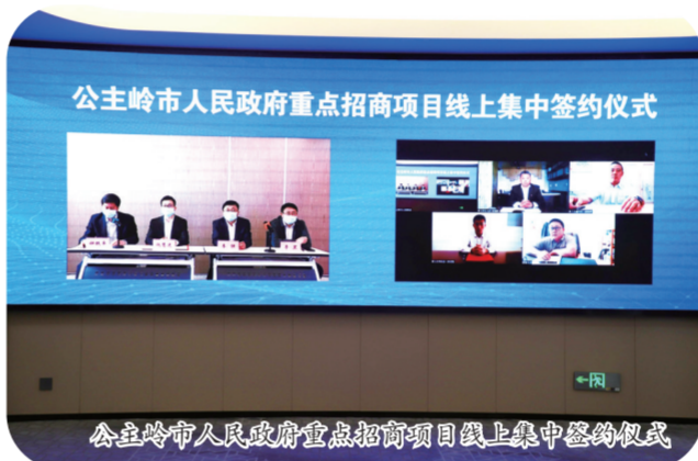
公主岭市人民政府重点招商项目线上集中签约仪式

艰难困苦,玉汝于成。争分夺秒地跑起来,快马加鞭地干起来,在充满希望的新起点,岭城发展再谱新篇。