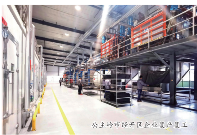
公主岭市经开区企业复工复产

助企纾困,成为公主岭复工复产的必答题。想企业所想、急企业所急,帮企业所需,解企业所难,全市一盘棋。“没想到只用了一个小时就办理完了验收手续,给我行