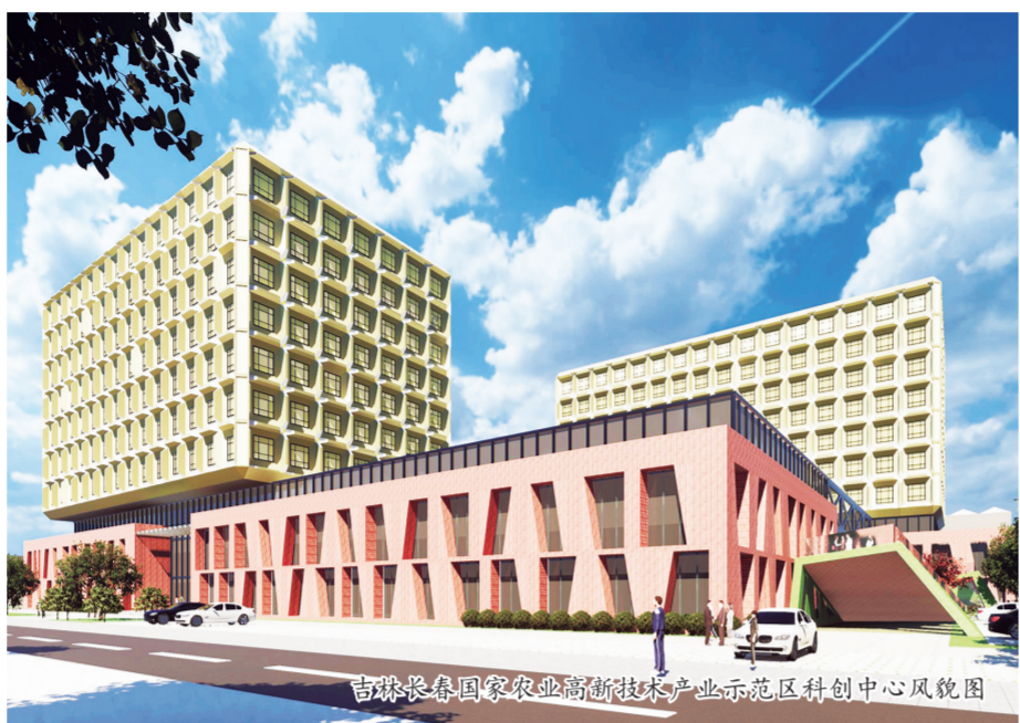
吉林长春国家农业高新技术产业示范区科创中心风貌图