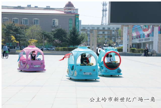
公主岭市新世紀广场一角