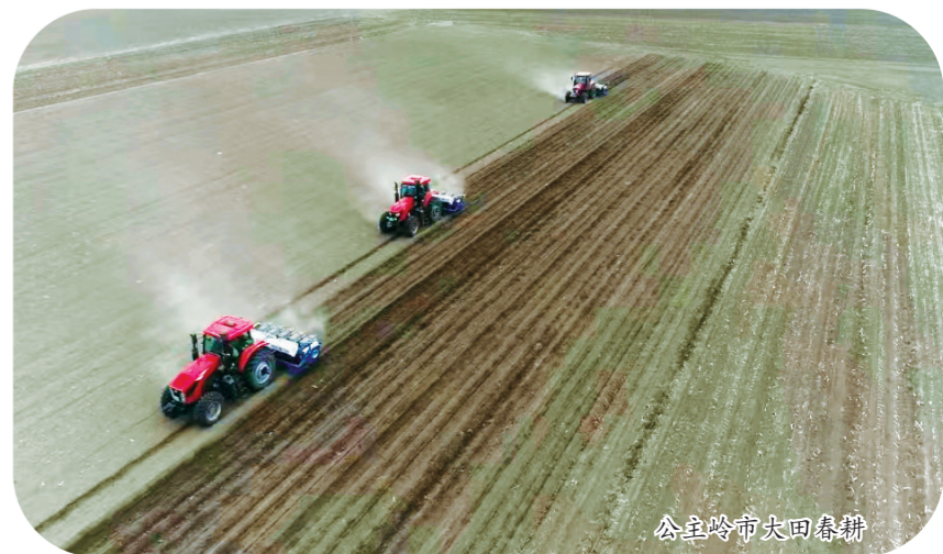
公主岭市大田春耕