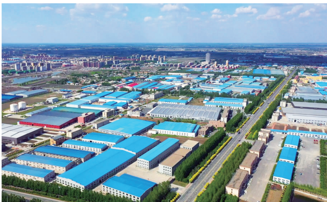
长春农安经济开发区航拍图

在新一届县委、县政府领导下,农安县全面贯彻党中央和省、市的决策部署,以“一主六双”“六城联动”为统领,深入实施县域发展“五五战略”,“1134”基础工作布局全面展开。全县“稳一产、强二产、优三产”发展思路清晰。一产方面,农安县发挥传统农牧产业大县和吉林省率先实现农业现代化的扩权强县试点县优势,在粮食安全、畜牧增收上下大气力、做足文章;二产方面,整合县域内工业开发区板块,倾力打造