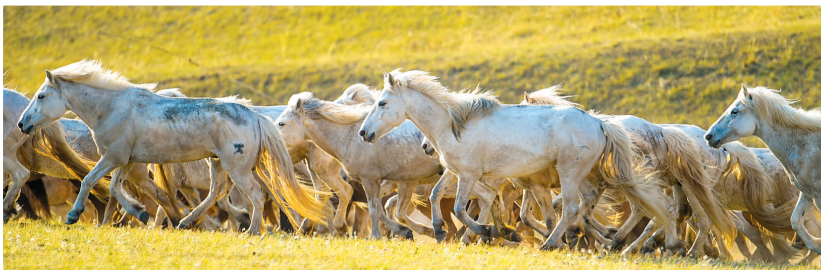
5月17日,马群在锡林郭勒盟西乌珠穆沁旗的草原上疾驰。