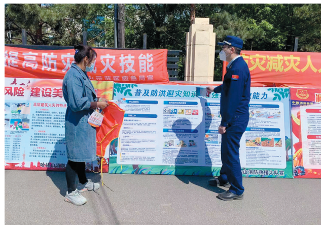
最近,松原哈达山生态农业旅游示范区消防救援大队践行党建和业务工作深度融合,持续开展消防宣传进乡镇进企业进农村活动,为企业上门解决消防难题,进行消防宣传培训,助力优化营商环境和复工复产工作。

此次消防产品质量专项检查及宣传活动,切实提高了广大人民群众对消防产品的辨识能力,有效净化了消防产品市场,为辖区消防安全稳定提供了有力保障。