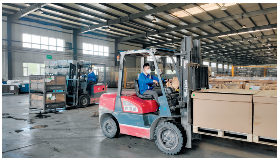
吉林省通用机械有限公司物流园区内工人有序运输货物。

种种数据表明,我省经济长期向好的发展趋势没有变,我省完全有条件、有能力全面战胜疫情、推动经济发展尽快恢复到正常轨道。而实现这个目标,需要全省企业的共同努力和支持。