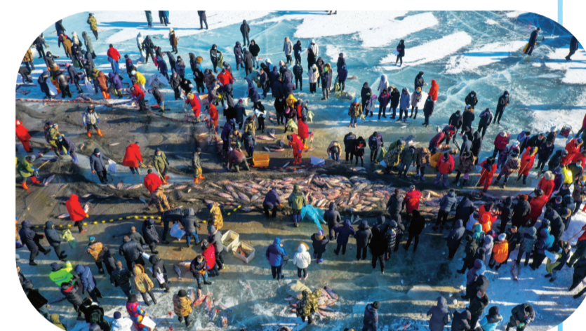
与生态相结合的旅游业蓬勃发展