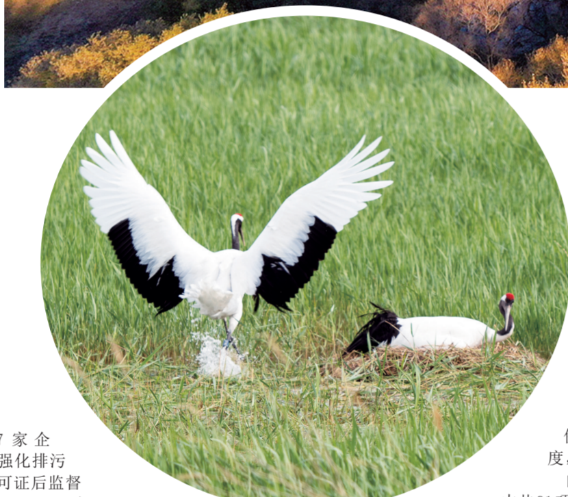
丹顶鹤在湿地繁育