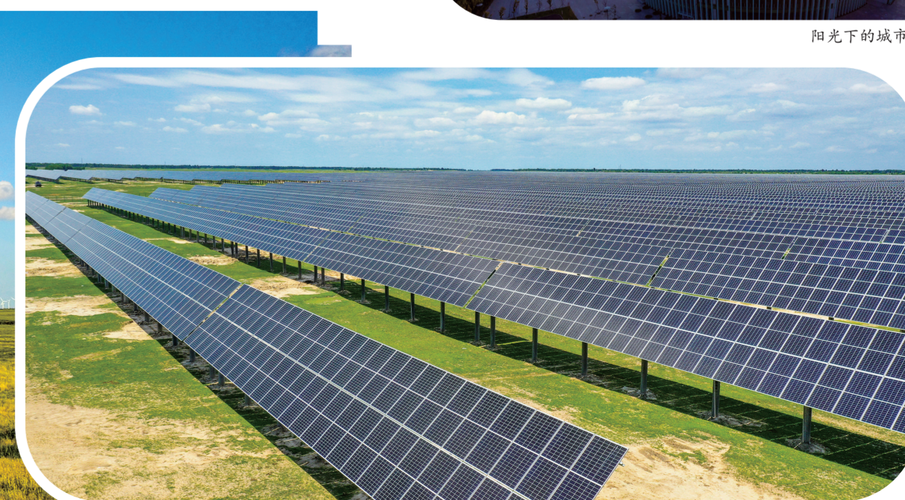
以风能、太阳能发电为主的清洁能源产业发展迅速

白城市正借助这些政策利好,加快建设“一城三区”(区域中心城市、生态经济先导区、乡村振兴创新区、生态文明示范区),充分发挥白城“区域位置独特、农牧资源丰富、清洁能源富集、生态环境优良”特点,高起点、高标准谋划白城“十四五”生态环境项目。白城市坚持生态优先、绿色发展,在保护和修复好生态的前提下,加快生态建设,打造碳汇白城,推进“两山”转化,实现生态环境系统性改善,再现“河湖互济、草茂粮丰、渔兴牧旺、人与自然和谐共生”的生态美景,推动白城高质量跨越式发展、全方位振兴。