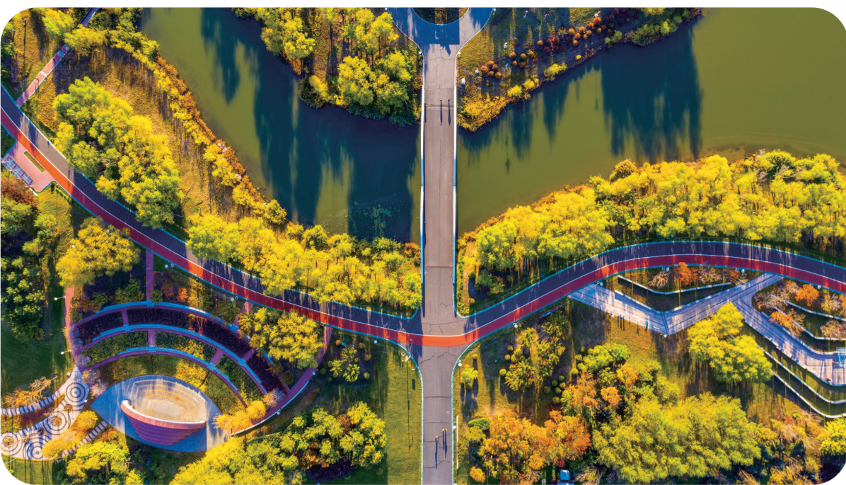
城市建设与生态建设相结合

作为吉林省西部重要生态屏障,白城市牢固树立“绿水青山就是金山银山”的理念,坚持生态强市,突出环境优先地位,打生态牌、走绿色之路,努力实现经济发展与环境改善双赢。白城市坚决打赢蓝天、碧水、净土、草原、湿地保卫战,为经济和社会高质量发展创造良好的生态环境,让“天蓝、水清、地绿”的优美生态环境成为白城高质量发展的底色,助推经济社会发展不断向上向好。