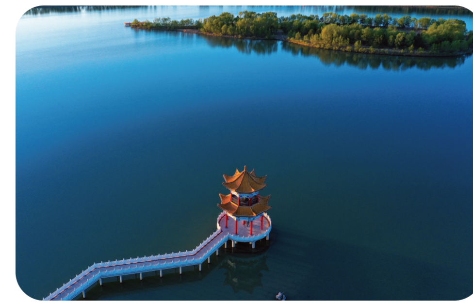
静谧美好的嫩江湾

白城市坚持生态产业化、产业生态化,做大做强低碳工业、绿色农业、生态旅游“三大板块”,力争“十四五”期末经济总量翻一番,跻身全省中游。