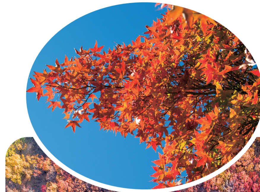
一空气质量优良天数排在全省前列