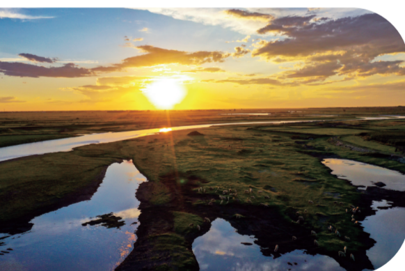
河湖互济,草茂粮丰,渔兴牧旺