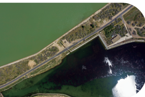
河湖连通工程使水资源丰沛