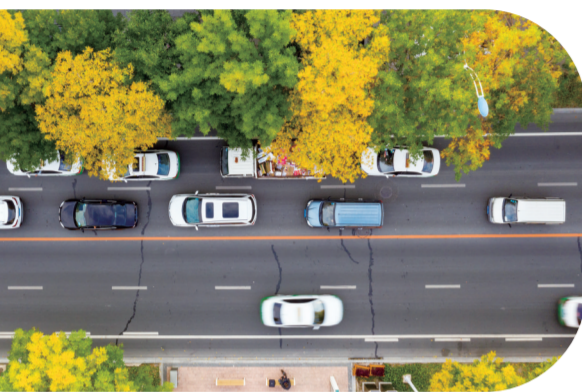
车辆穿梭,仿佛置身城市绚丽画卷

白城市坚持绿色发展方向,严格规划引领和产业带动,将污染物排放总量控制作为项目引进的先决条件。严格“两高”项目节能审查,从源头把关严控“两高”项目。截至目前,白城市无产能过剩行业(钢铁、水泥、平板玻璃等)新增产能项目。全面实施排污许可管理制度,2020年实现全市企业排污许可全覆盖,纳入日常监管企业2781家。对全市实施证后管理的