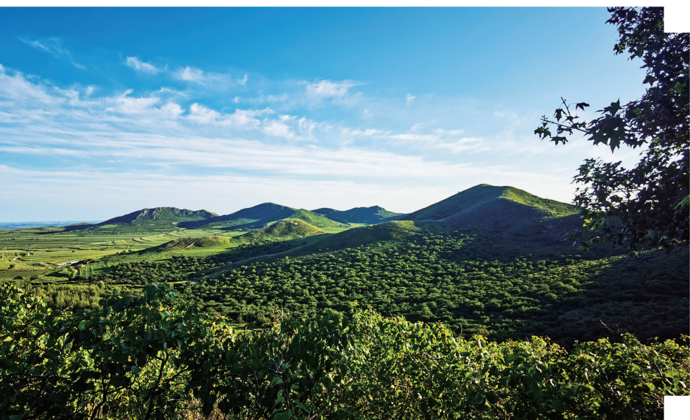
植被茂盛,生态环境优越