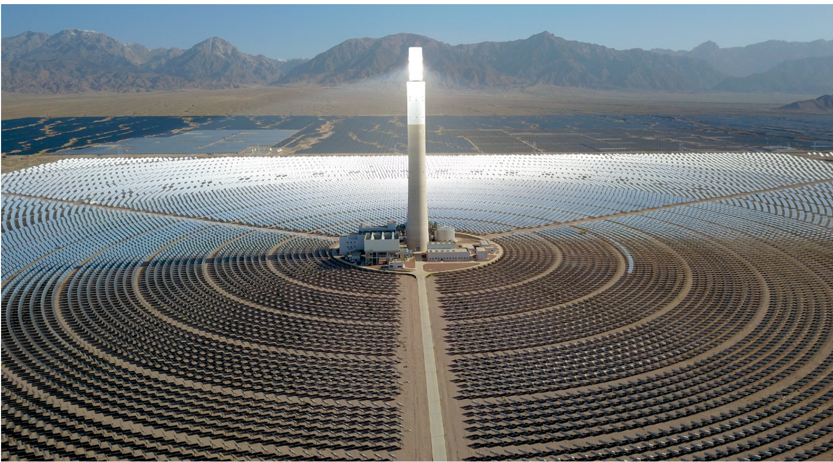
这是6月8日在海西蒙古族藏族自治州德令哈市光伏（光热）产业园拍摄的青海中控德令哈50兆瓦光热电站（无人机照片）。

今年以来，地处柴达木盆地的青海省海西蒙古族藏族自治州在已建成千万千瓦级新能源产业集群的基础上，依托域内丰富的光照、风能以及荒漠、戈壁等资源，新开工建设中广核200万千瓦光伏光热项目、青豫直流二期20万千瓦光热项目等5个新能源项目。目前项目开工建设正在有序推进。