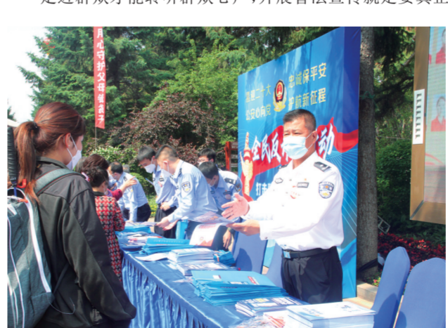
反诈宣传志愿服务队在长春市南湖公园门前开展反诈宣传

走到群众中去。“蓝盾初心”普法宣传志愿服务队创新传播渠道,弘扬法治精神,传播法律知识,对内提高公安机关执法水平,对外提升人民群众知法、懂法、守法意识。