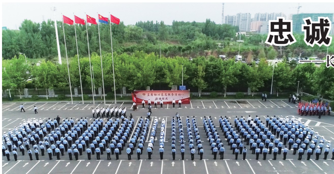
长春市公安局举行“蓝盾初心”志愿服务活动启动仪式

美国网站“枪支暴力档案”最新数据显示,今年以来,美国已经发生256起造成至少4人死伤的枪击事件,超过1.9万人因枪支暴力失去生命,包括735名未成年人,其中158人不到12岁。(新华社华盛顿6月11日电)