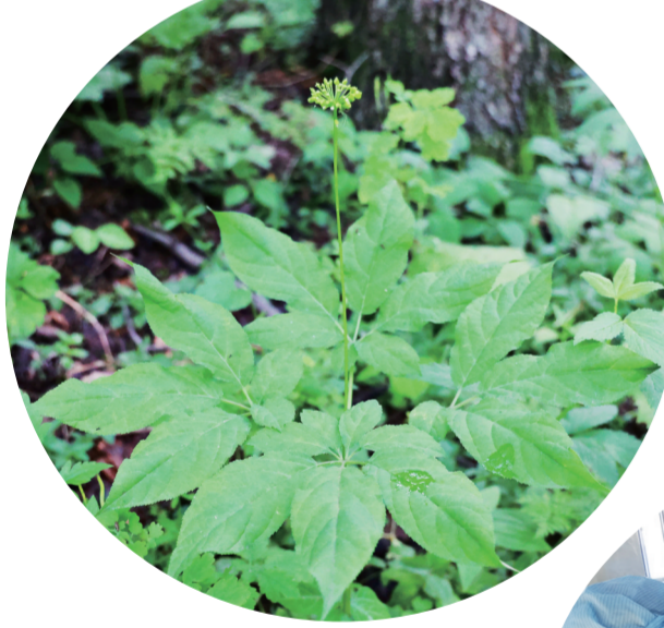
↑人参开花。 —洋人参保健品生产线。

前不久,我省出台40条重点措施推进人参产业高质量发展,努力打造千亿元优势产业。一时间,犹如“强心针”,激