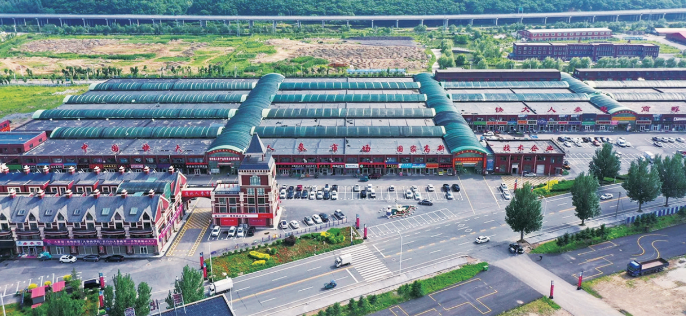
红色之城 康养胜地