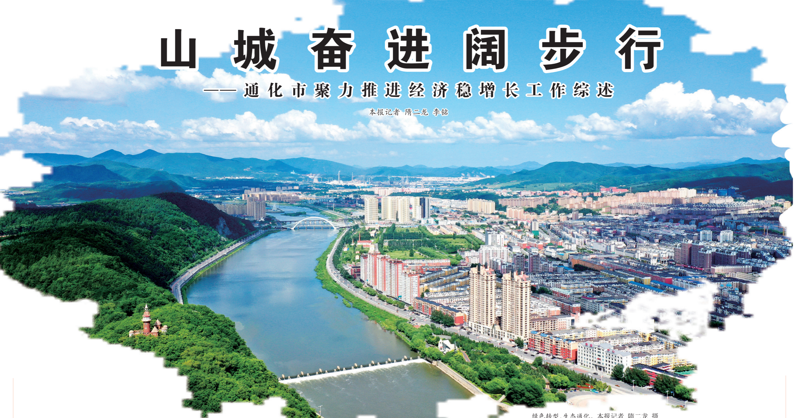
绿色转型,生态通化。

发人参产业新的“春天”。通化市抢抓机遇,今年4月,将“人参花”确定为市花。人参,这一闻名遐迩的百草之王再一次惊艳了人们的眼光,进一步擦亮了“世界人参看中国,中国人参看吉林,吉林人参看通化”的品牌。2021年,通化市人参产业总产值达300亿元。目前,全市人参加工企业累计发展到450户,全国3户A股人参加工企业全部坐落在通化(益盛、紫鑫、康美)。开发涵盖了药品、保健品、食品、化妆品、生物制品等5大系列人参相关产品800多种。通化建设了以非本地人参交易为主的通化伏大人参交易市场和以林下参交易为主的中国·清河(溟洋)野山参国际交易中心,已成为全国人参交易的集聚区。“十四五”期间,通化市人参产业确定了努力打造成“世界之都”,逐步发展成为全球人参产品集散中心、国际人参文旅康养中心、世界人参高新技术产业示范中心的发展战略。而有着“中国葡萄酒城”美誉的通化市,葡萄酒富含深厚的文化底蕴、鲜明的风土特色和坚实的产业基础。近年来,紧紧围绕“产区建设、标准种植、营销推广、精品酒庄、科技创新、品牌创建”六项重点工作打造产业强市,葡萄酒产业生机勃勃。据了解,通化市现有葡萄酒企业60户,其中上市企业2户,全市葡萄酒种植基地保有量为3.5万亩。截至今年4月,规模以上企业实现产值0.6亿元,同比增长21%。从酿酒品种的选定到标准种植的研究,从冰酒酿制工艺的提升到产品体系的全面升级,通化市已经探索出一条中国特色的葡萄酒产业发展之路,尤其是以“北冰红”为代表的山葡萄酒品质得到全面提升。2016年以来,通化葡萄酒产品在各类世界顶级酒类大赛中荣获金奖56个、银奖铜奖70个。通化冰葡萄酒酿制工艺已经达到中国顶级冰酒水平,正在向世界顶级水平迈进。与此同时,通化市不断推进产业融合,积极谋划“葡萄酒+旅游”发展模式,着力打造精品酒庄建设。目前,集安麦翁酒庄主体工程进入收尾阶段,年内可进行试生产;通股份青石酒庄项目正在进行场地平整,万通葡萄酒扩能改造项目正在进行设备安装调试;福海酒庄项目正在进行灌装车间、地下酒窖建设。酒香四溢,“一往”参情。致力于铸造人参、葡萄酒产业的通化,正乘势而上、砥砺前行。