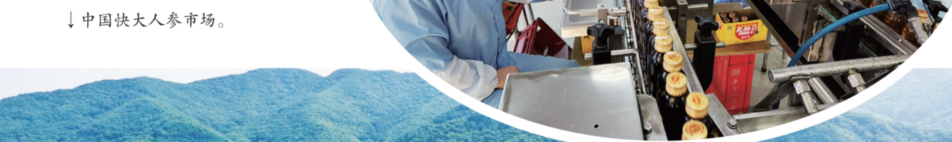
↓中国伏大人参市场。