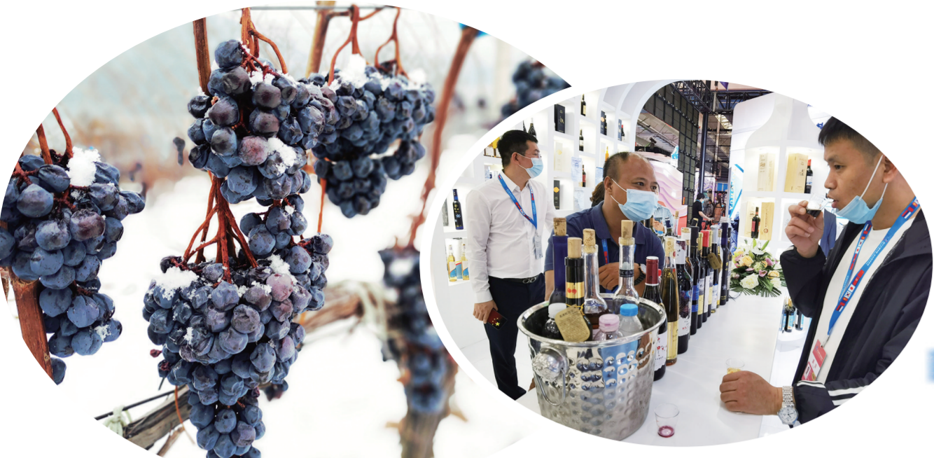
鸭绿江河谷孕育的北冰红冰葡萄。(资料图片) 通化葡萄酒亮相第十三届中国-东北亚博览会。(资料图片)