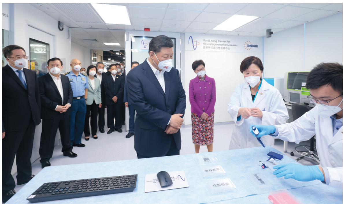
六月三十日下午,国家主席习近平在香港特别行政区行政长官林郑月娥陪同下,来到香港科学园考察。这是习近平在香港科学园考察。

新华社香港6月30日电(记者朱基钗 陈键兴 赵博)30日下午,国家主席习近平在香港特别行政区行政长官林郑月娥陪同下,来到香港科学园考察,同在港中国科学院院士、中国工程院院士和科研人员、青年科创企业代表等亲切交流。