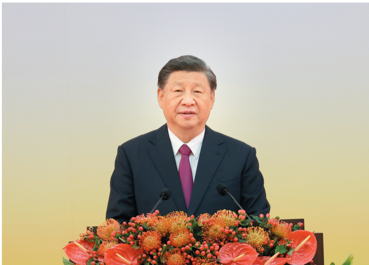
7月1日上午,庆祝香港回归祖国25周年大会暨香港特别行政区第六届政府就职典礼在香港会展中心隆重举行。中共中央总书记、国家主席、中央军委主席习近平出席并发表重要讲话。