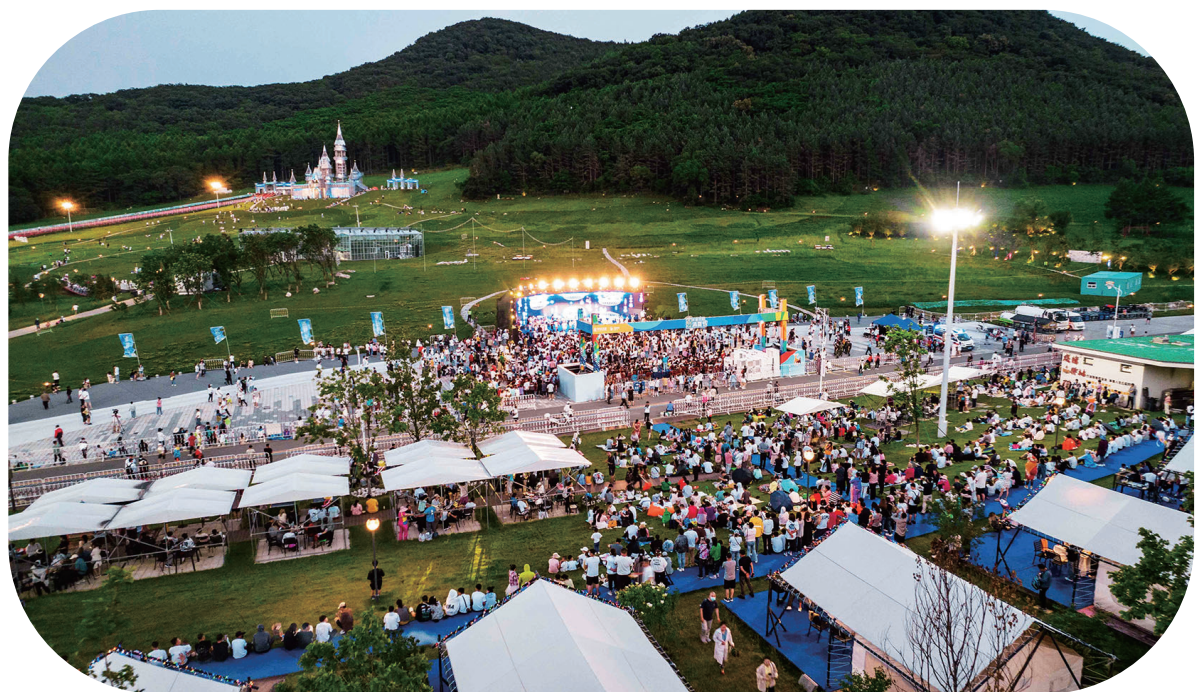
“微度假”模式深受游客喜爱