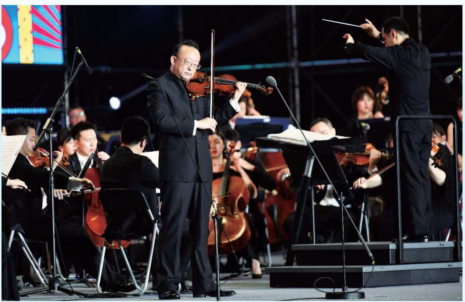
中央歌剧院院长、著名小提琴演奏家、“长春文化使者”刘云志精彩的小提琴表演,让人听得意犹未尽