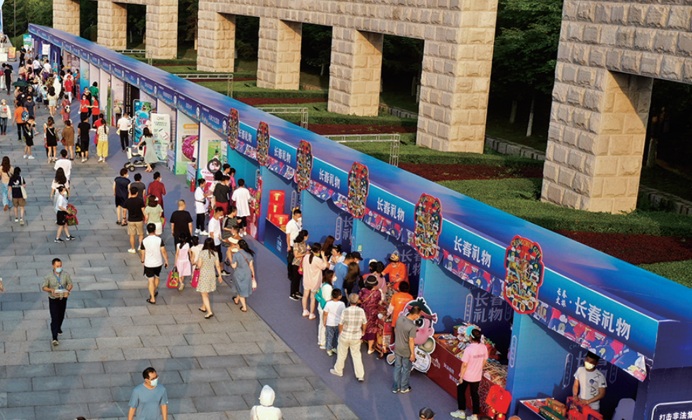
市民尽享长春22℃的夏天