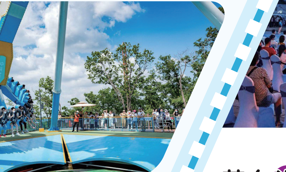
神鹿峰旅游度假区