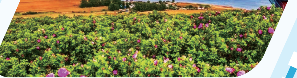
玫瑰山旅游度假区