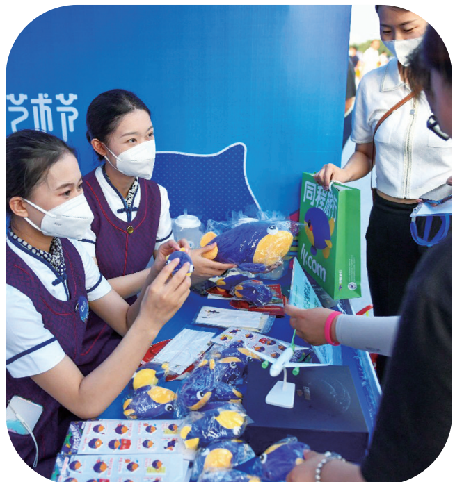
消夏文化夜市吸引了众多市民和游客前来观光购物

各具特色的线上消夏活动和促销活动拉动了文旅消费。目前,新媒体传播的形式越来越吸引人们青睐,同时可有效避免人员在室内聚集,各企事业单位针对节日和消夏季推出了形式多样的线上活动和促销活动,带动更多群体参与。德惠市推出线上象棋等系列比赛,文庙博物馆和少儿图书馆的线上国学讲座和科普小课堂,很受孩子们和国学爱好者欢迎;长春新区以三大商场为依托,推出一系列线上优惠福利,长影旧址博物馆推出线上粉丝福利抢票活动,关东学院、巴图鲁乐园面向高考群体开展免费体验活动和复工酬宾活动,有效带动文旅消费。