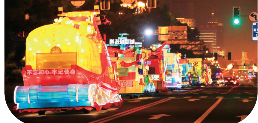
花车巡游成为夜晚长春的流动风景线

一年一故事,一年一风景。行驶在马路上的台台花车组成一道移动的风景线,点亮长春的夜晚,也让