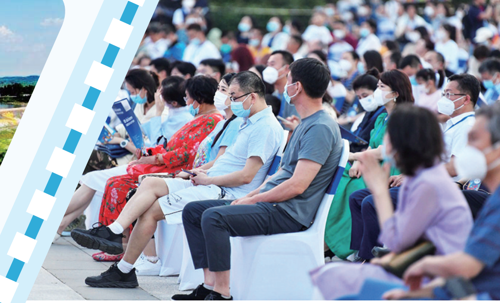
精彩的开幕式活动吸引众多市民观看