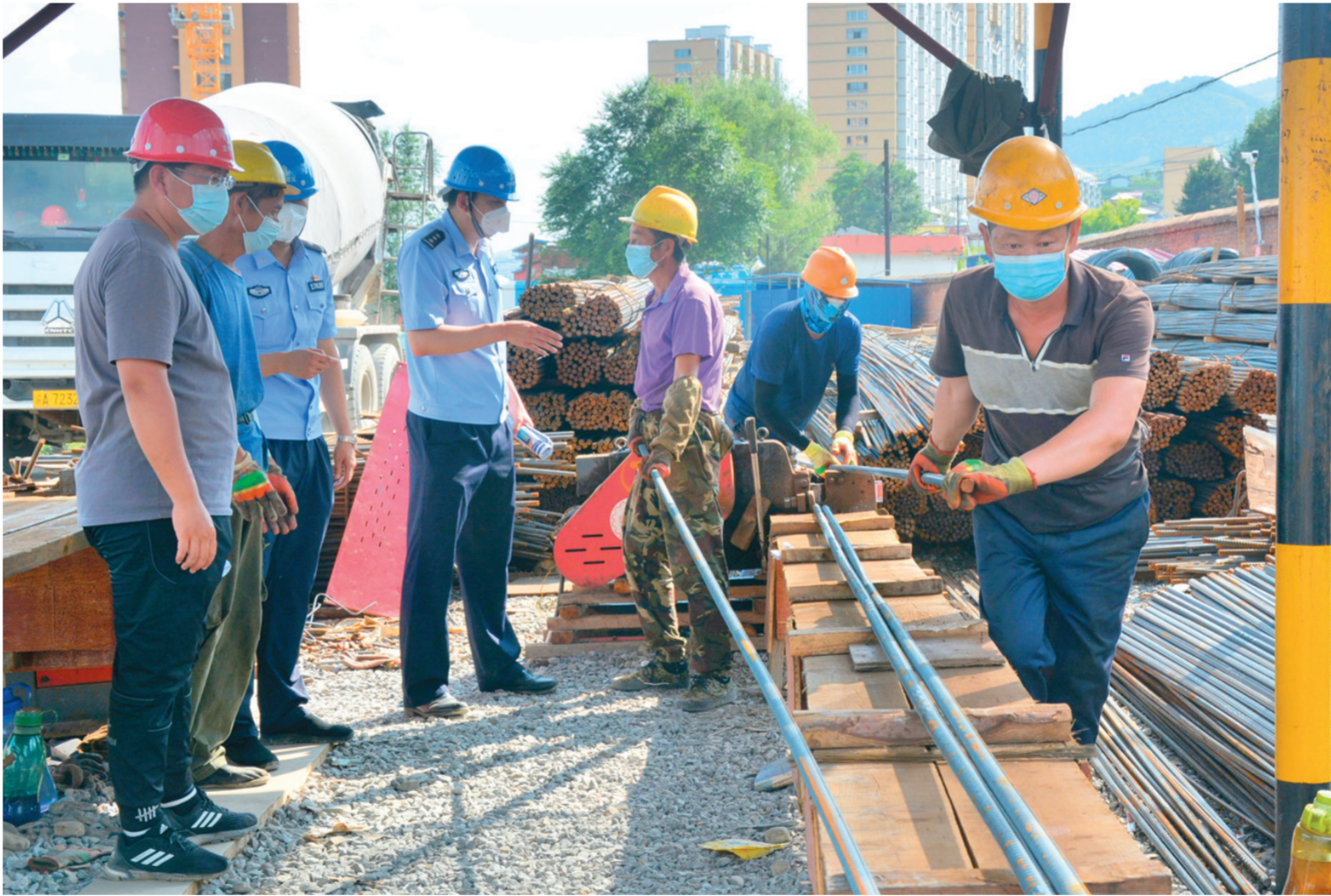
为进一步强化安全管理,近日,吉林白山边境管理支队新市边境派出所深入辖区建筑工地开展安全检查,督促工地负责人严格落实各项安全防范措施,避免事故发生。

为把党代会精神转化为加快发展的强大动力,合作社计划创新土地集约方式,实现“整村推进土地规模化种植、全程机械化作业”目标,带领村民进一步推广保护性耕作“梨树模式”,打造优质绿色的农产品。借助“秸秆变肉”工程,发展肉牛养殖,充分利用玉米秸秆资源,一部分回归到土地中作为土壤养分资源,另一部分作为养牛饲料资源,将秸秆资源化利用程度发挥到最大,实现秸秆还田能养地、离田能变肉。