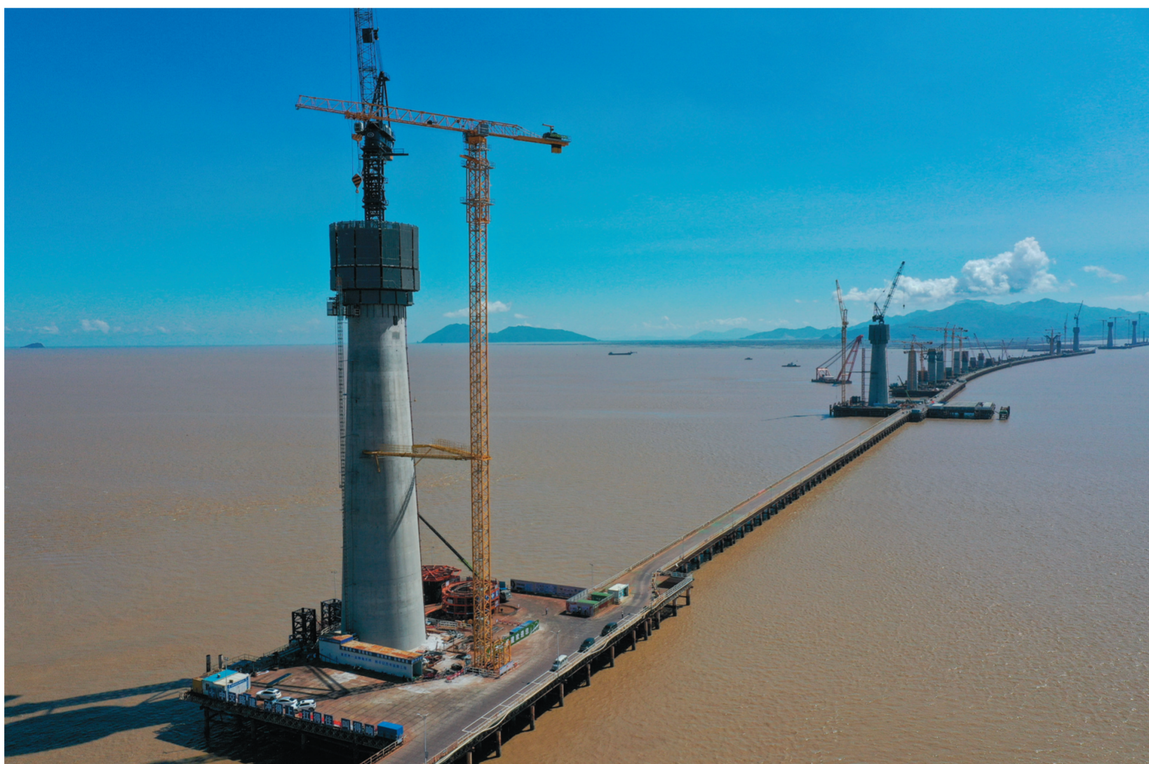
建设中的黄茅海跨海通道高栏港大桥东主塔(前)(无人机照片,7月12日摄)。目前,黄茅海跨海通道高栏港大桥建设进展顺利,大桥东主塔已完成15个节段约87米高度的建设。高栏港大桥东连从港珠澳大桥连接引出的鹤港高速,西接黄茅海大桥,是黄茅海跨海通道的组成部分。黄茅海跨海通道横跨珠江口崖门入海口黄茅海水域,线路全长约31公里,预计2024年建成通车。