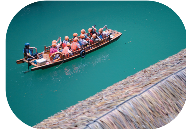
7月12日,游客在湖北省鹤峰县芙蓉镇屏山村屏山峡谷坐游船游玩。夏日,人们纷纷选择亲水消暑,乐享清凉。

外读者深刻理解习近平外交思想的丰富内涵,深入了解构建人类命运共同体重要理念、新时代中国特色大国外交伟大实践以及中国之路、中国之治、中国之理等,具有十分重要的意义。