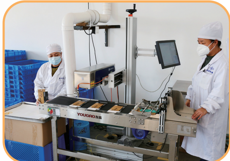
德商药业生产车间。