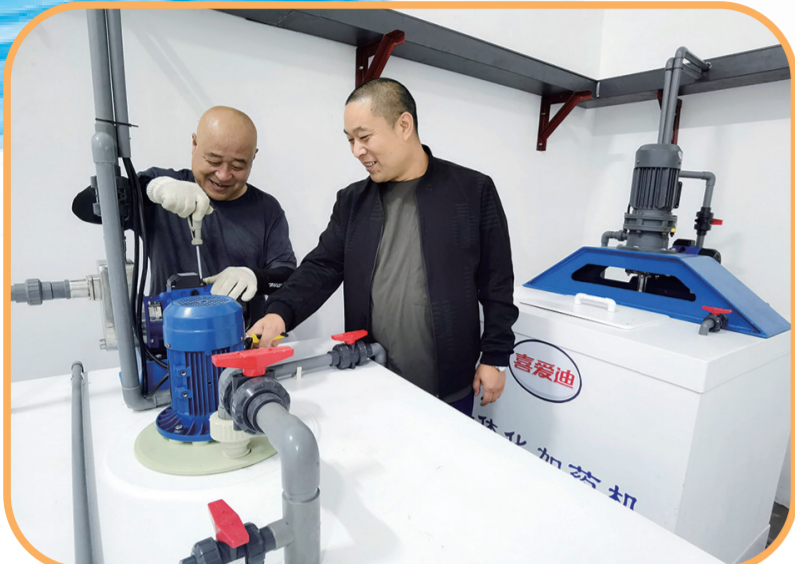
喜爱迪生物科技建设项目,生产设备组装完毕。