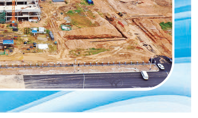
开展“民营企业招聘月”活动,满足百姓就业需求。