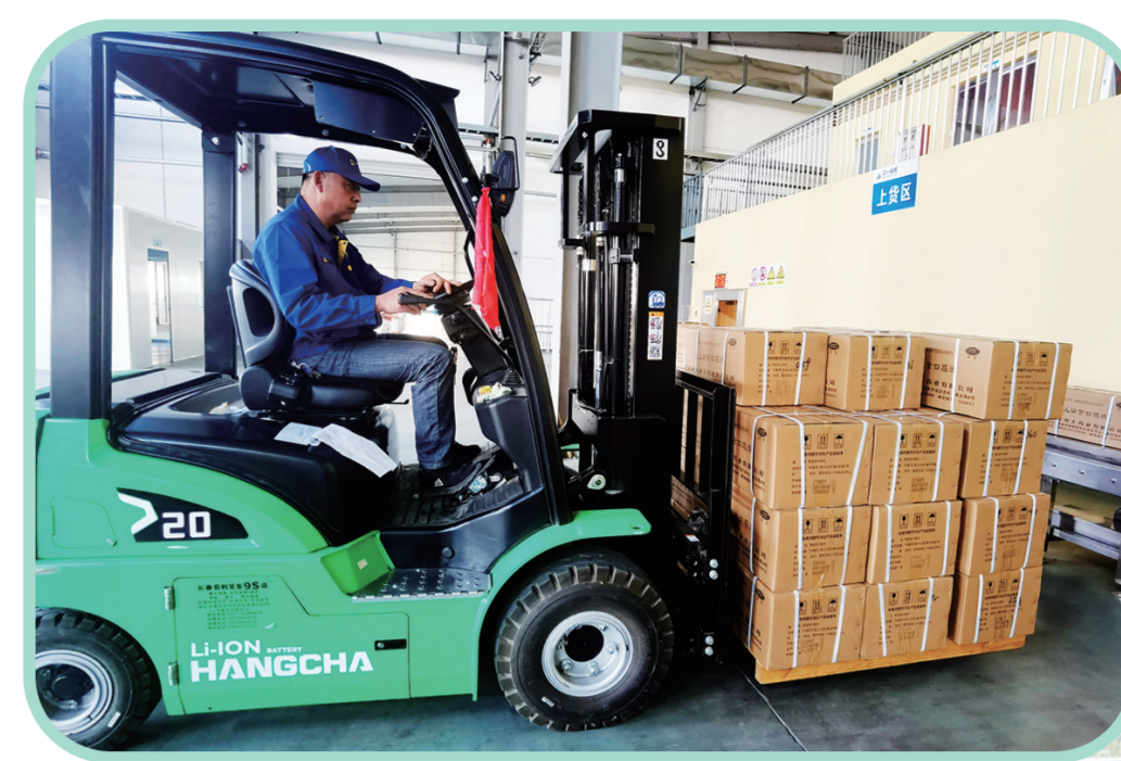
众一福照生产车间正在加速工序运转。

“企业快速增长的好政策如同及时雨,不仅解决了企业燃眉之急,还为了今后的发展提供了强力支撑。”一系列稳增长举措落到实处,让德商药业负责人王雨平赞不绝口。 与此同时,辉南县全面落实县领导包保责任制,强化运行调度、分析、监控,帮助企业排忧解难,协调解决各项问题,确保企业稳定运行。积极推动铁路跨越式扩等11个建成项目投产达效,鼓励农机公司开展代加工,帮助福源药业开展第三方销售合作,推动国药集团参股高逸药业,上半年产值5000万元。 突出项目支撑,积蓄发展势能,紧盯国家政策导向和资金投向,目前争取资金13.2亿元。坚持线上线下同步招商,与上海东方龙等企业紧密合作,40万立方米成品油储罐、京安器材厂等40个项目进展顺利。 深入落实重点项目县级领导包保和审批服务联席会议制度,认真实行“一项目一领导、一专班一秘书”工作机制,33个5000万元以上重点项目全部开工,喜发地、百思万方、俊逸药业、利尔科技、白高铁路板厂、天耀北方生物技术加快推进。 一系列行之有效的“稳增长”举措,为项目建设和企业发展提供了动力、提振了信心。 发展时不我待,实干成就梦想。 将经济增长作为高质量振兴发展的重点任务,辉南县固根本、强引擎,全县上下敢拼敢闯、敢想敢干,正为推动全省经济稳增长贡献辉南力量。