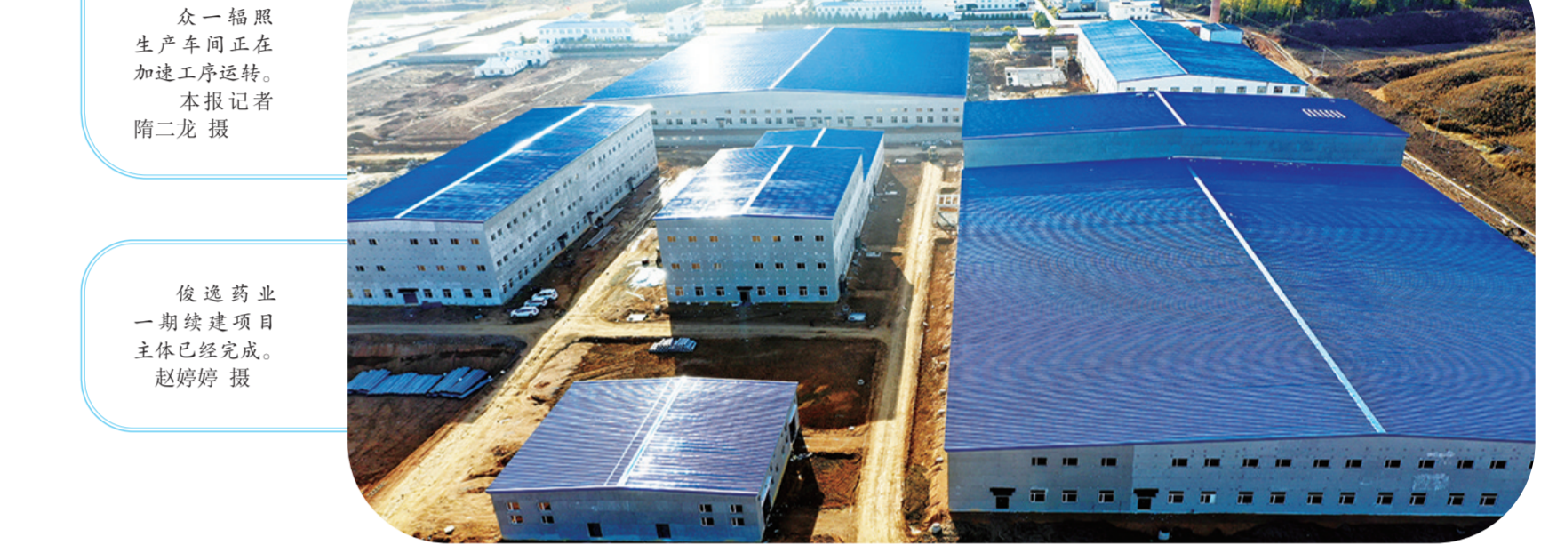
俊逸药业一期续建项目主体已经完成。