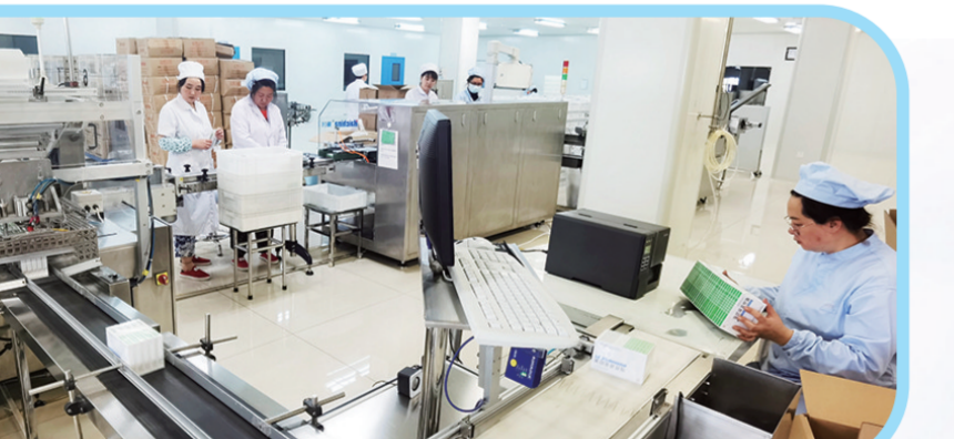
↑ 龙生生物药业生产线高速运转,新建的生物提取项目也已投入试生产。

谈起政府为企业“保姆式”的服务,车成程激动地说:“‘信贷易’平台可以直接以信用为担保进行贷款,充分解决了我们融资难、融资贵的问题。同时,人社局也和我们宣传创业担保贷款政策,利息非常低。有了官方的融资政策,我们放心、安心!” 在辉南,融资难融资贵不再让企业一筹莫展。有了“政银企金融服务平台”和企业融资需求对接周报机制,加上精内银行金融机构对提出延期还款本息申请的企业给予“应延尽延”46户融资需求企业已有29户获得县内各银行授信或发放贷款金额共计6.5亿元。 提升营商环境“软实力”,辉南县用“硬举措”托底,培育经济发展新动能。聚焦项目建设,依托县政务大厅开辟绿色通道,实行项目服务领办代办,为投资者提供超前服务,实现“办事不出区、山区我代办”、“全程”“妈妈式”服务,推动吉林百思万方、德商药业等新兴产业项目早日落地投产。