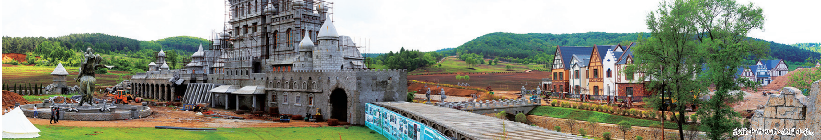
建设中的田园·德国小镇。

推进法治乡村建设。深入开展法律“六进”“美好生活·民法典相伴”暨文化科技卫生“三下乡”宣传活动，发放各类普法宣传资料5000多份，解答咨询近3000人次，受众5000多人。