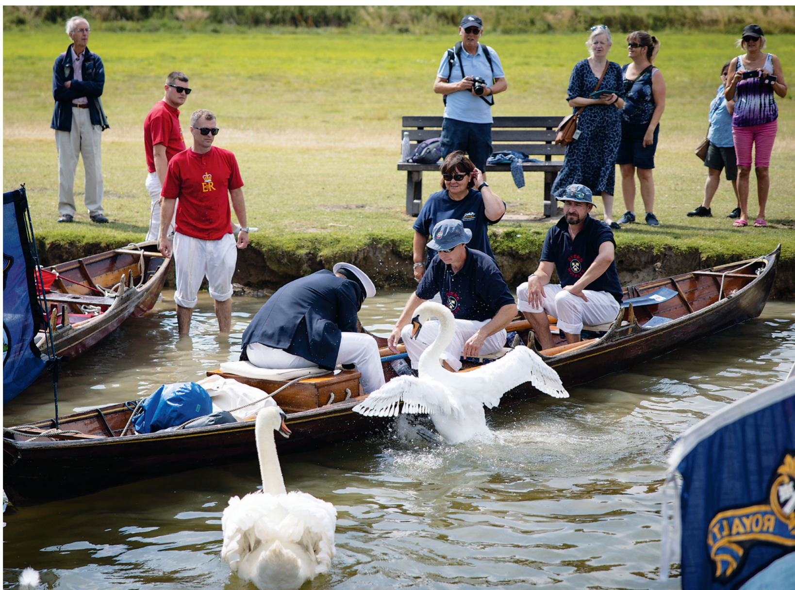
7月20日,工作人员在英国泰晤士河畔亨利附近开展天鹅普查。英国每年7月都要在流经英格兰东南部的泰晤士河段开展天鹅普查,清点天鹅数量,测量它们的大小、体重并检查身体状况。英国开放水域所有不带标记的天鹅传统上归英国君主所有,因此天鹅普查属于白金汉宫事务,从1186年起成为年度活动。