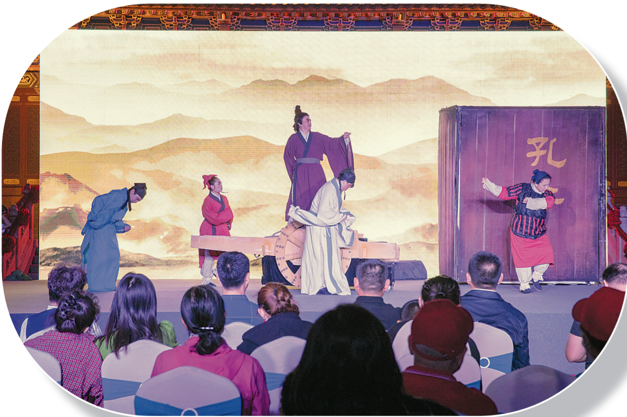
形式多样的文化演出。

长春市文庙博物馆在研学活动中重视交流互动，让学生学到知识，有话可说，形成坚持展示、倾力展示、创新展示的互动局面，促进学生表达、总结、反思、融会贯通，真正做到了“传”与“承”并重。