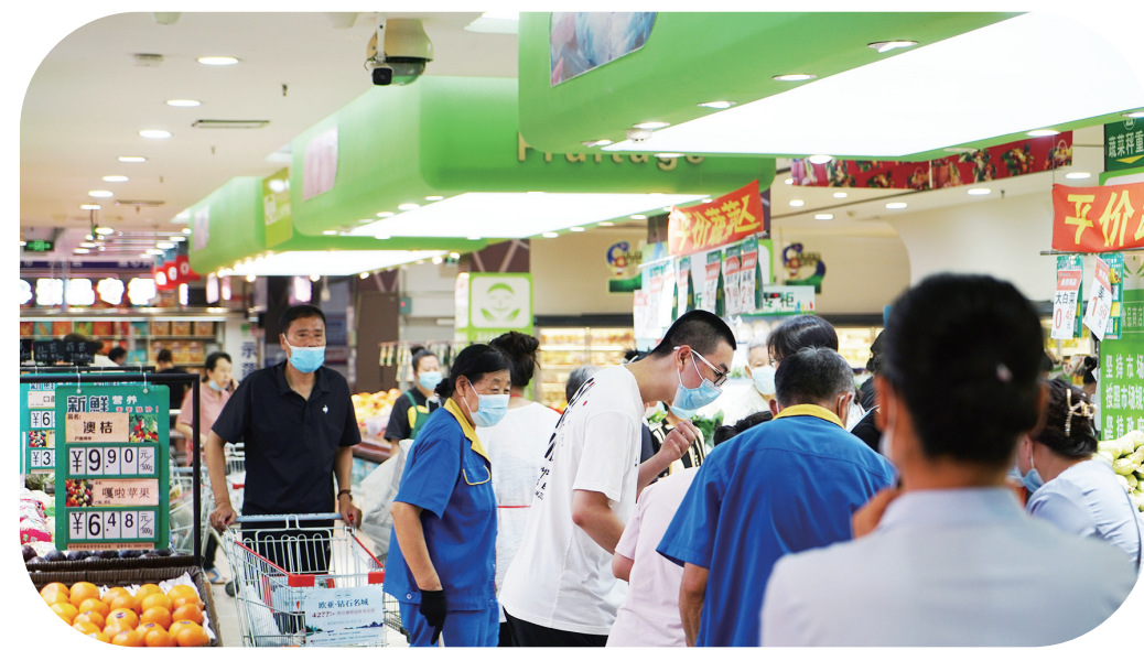
消暑购物节期间,四平欧亚购物中心内人潮涌动,日均交易笔数近万笔,总销售额达700万元。

此外,全市电子商务高质量发展。1月至5月,四平市网络零售额实现5.29亿元,同比增长6.2%。建设完成了1个本土自营电商平台——惠邮到家,培育了10名网红带货达人;成功举办了中国新电商大会四平市网销产品开放日系列活动,全面推介本地10款网销优品,设置四平特色农副产品、四平特色餐饮、吉林省老字号、进口商品、网销供应链产品5个展区,组织33家企业、800多种产品参展。吉什里数智供应链平台与四平邮政、万邦、长春地利生