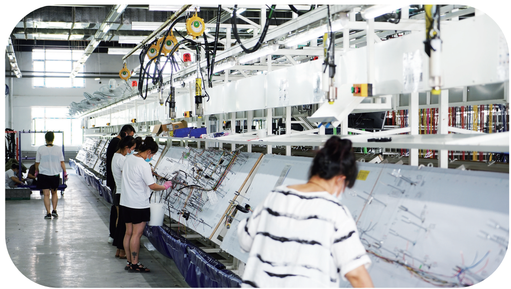
吉林华凯比克希线束有限公司从招商签约到正式投产,只用了半年时间。图为公司厂房内,工人们正在作业。

立足“真落”,持续推进引资额到位。对全市在建的招商项目,定期开展梳理排查,按照周调度、旬预警、月通报的机制持续跟踪,根据项目资金到位率情况进行精准分类,帮助企业破解项目建设中遇到的困难和问题,推动在建招商项目顺利建设。今年上半年,全市纳入省调度系统省外1000万元以上有资金到位的项目231个,到位资金115.94亿元。其中,续建项目64个,新到到位资金77.08亿元;新开工项目167个,到位资金38.86亿元。