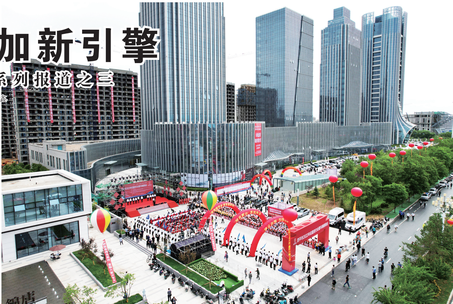
四平市2022年初夏房交会暨车展展销会·地产优质农产品展销会开幕式现场。

立足“深谋”,科学包装储备项目。围绕“八大产业”,精准谋划包装一批符合市情、可推介、可转化的招商项目。上半年,组织谋划包装招商项目24个,主要有:梨树县医药中间体系列产品项目、双辽年产30000吨多晶硅、伊通年产10万吨大米蛋白乳(奶)、四平经济开发区半固态铸造建筑铝合金模板、红嘴经济开发区装备