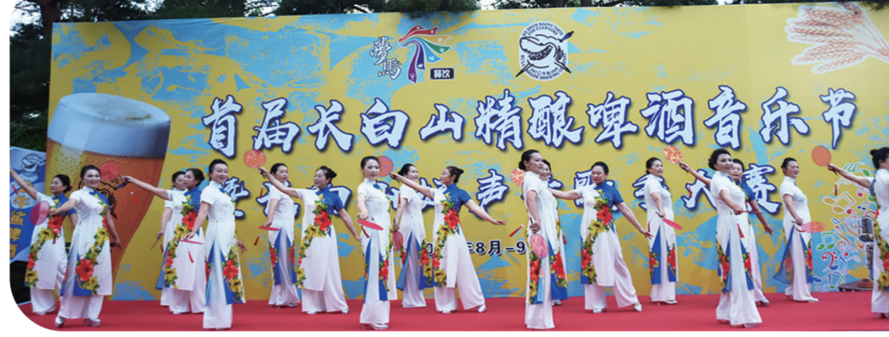
游客吃着烧烤,喝着啤酒,欣赏演出。