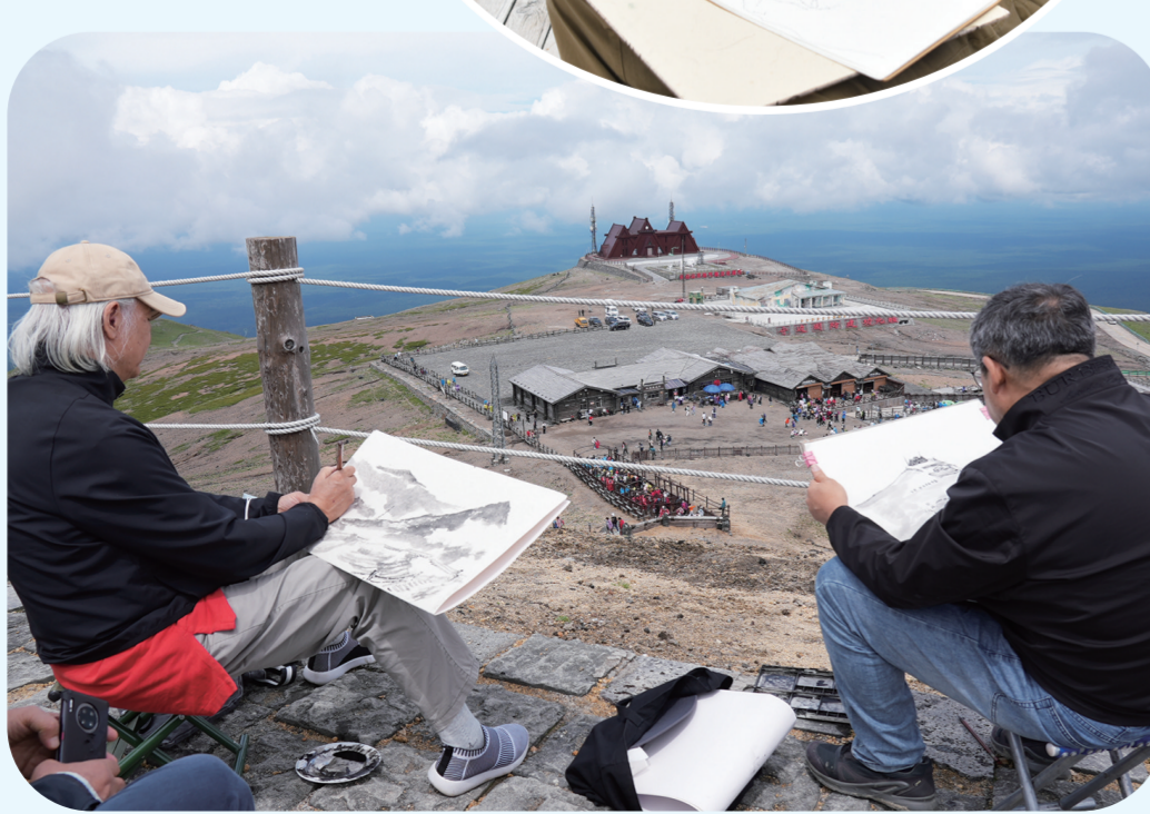
↓画家用手中的画笔勾勒出眼前的美景。