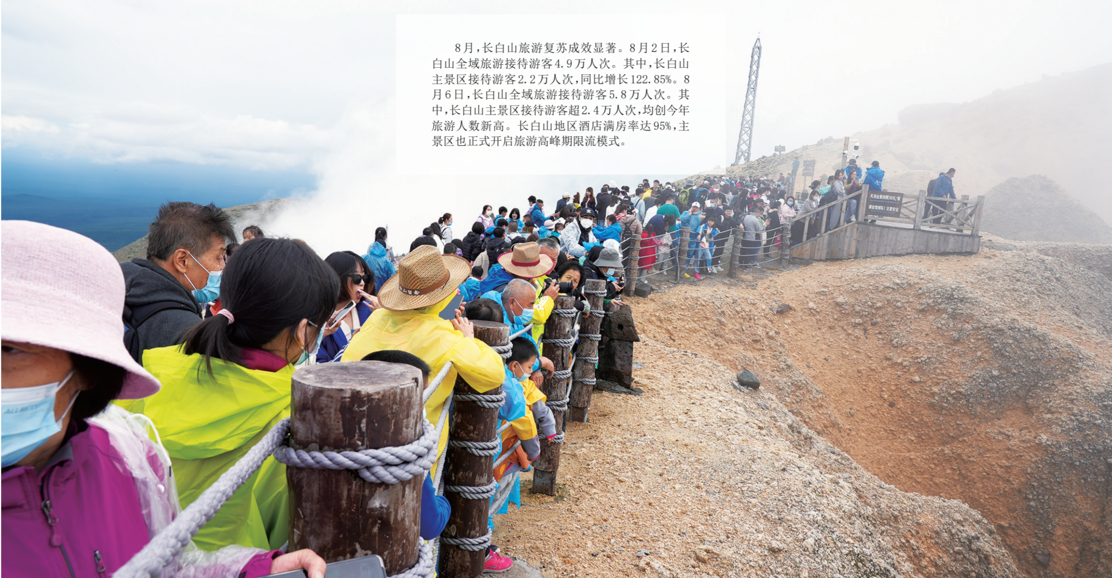
8月,长白山旅游复苏成效显著。8月2日,长白山全域旅游接待游客4.9万人次。其中,长白山主景区接待游客2.2万人次,同比增长122.85%。8月6日,长白山全域旅游接待游客5.8万人次。其中,长白山主景区接待游客超2.4万人次,均创今年旅游人数新高。长白山地区酒店满房率达95%,主景区也正式开启旅游高峰期限流模式。