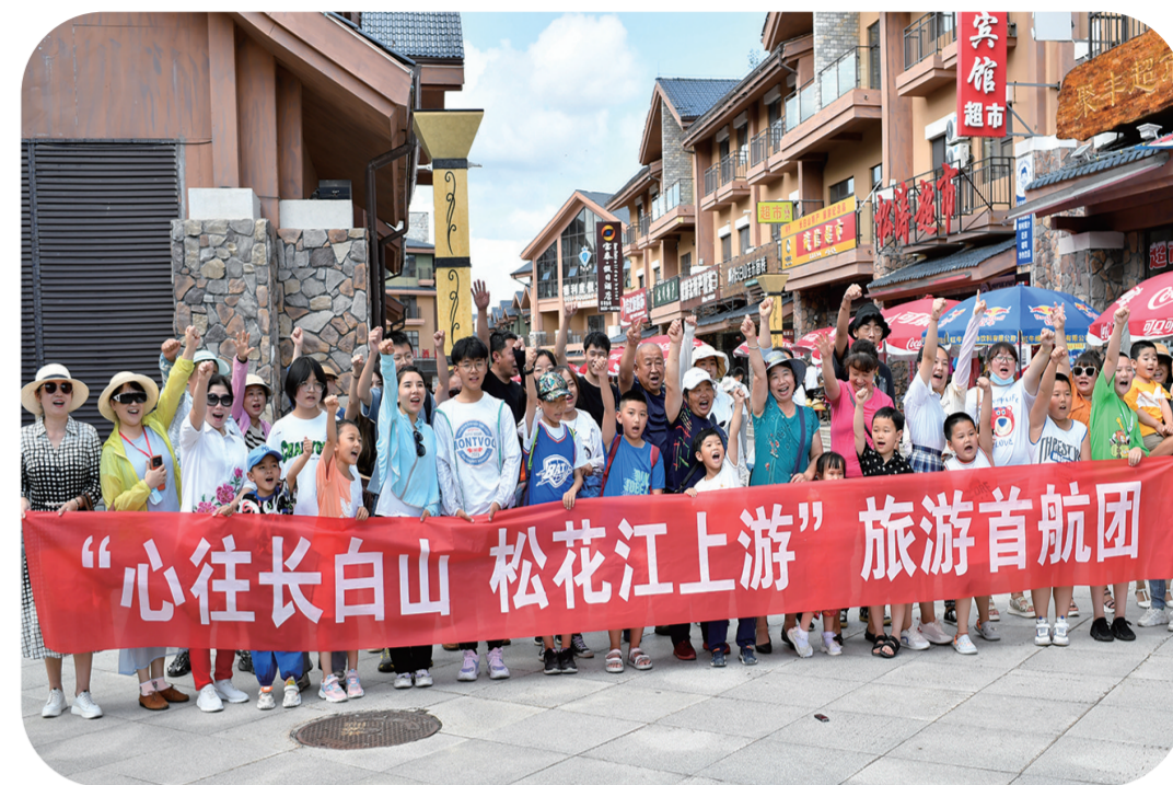
“心往长白山 松花江上游”旅游首航团出发。

下一步,长白山—松花江旅游集散中心将在咨询服务、接待能力、交通设施、娱乐休闲等方面不断完善,为“大游客”提供更优质服务、更好体验,努力提升环长白山地区文旅产业的科学管理水平,推动长白山地区文旅产业高质量发展,为全面践行“两山”理念试验区,加快推进白山—长白山保护开发区一体化协同发展贡献力量。