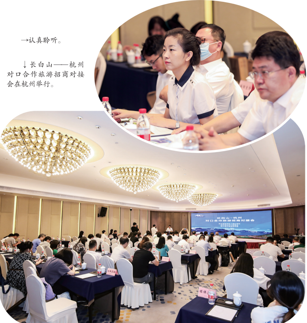
→认真聆听。 ↓长白山—杭州对口合作旅游招商对接会在杭州举行。

本报讯(李雨欣 记者孙寰宇)8月3日,由省府驻上海办事处、长白山保护开发区管委会、浙江省开发区研究会主办,吉浙对口合作服务中心、长白山保护开发区管委会旅游和文体局、长白山保护开发区商务局承办的长白山—杭州对口合作旅游招商对接会在杭州市举行。 对接会上,长白山保护开发区管委会详细介绍了今年暑期十大“网红线路”旅游产品和暑期重磅旅游优惠举措。同时,长白山保护开发区管委会带来长白山十八坊产业园、桦甸府综合体、池北综合性休闲度假、北国南山冰雪运动小镇、池西温泉综合体、月亮湾康养度假示范区六个重要文旅招商项目。 据了解,长白山十八坊产业园项目位于长白山池北区,项目总投资67亿元。拟建设长白山旅游休闲度假服务基地、国际健康企业总部基地、长白山特色产业生产及展示中心、滨河文化生态游憩中心和长白山文化创意旅游中心;池北综合性休闲度假项目计划打造大型演艺剧院、文化艺术广场、特色商业街区、酒店、娱乐、商业及文化交流于一体的综合性休闲度假目的地;位于池西区中心城区北侧的北国南山冰雪运动小镇项目毗邻长白山西景区服务中心、长白山万达国际度假区,周边基础设施配套齐全,主要为林地和整理的耕地,自然景观宜人,可塑性大。一系列长白山特有的产业项目在场的企业家、旅行商眼前一亮,并表示看好长白山的文旅投资前景。 此次活动中,长白山保护开发区管委会旅游和文体体育局携长白山集团、长白山旅行社、长白山鲁能胜地、万达国际度假区等文旅企业,通过整体产品讲述、优惠举措发布等,与浙江旅行社行业协会、旅行社代表充分交流,长白山特有的“22℃夏日”山地避暑”旅游再加上极具诱惑力的优惠价格,引发了在场旅行商的浓厚兴趣。旅行商纷纷表示会在了解之后,再次整合资源,在行业内启动宣传与营销推广,把长白山的凉爽与优惠政策带给更多的杭州市民。