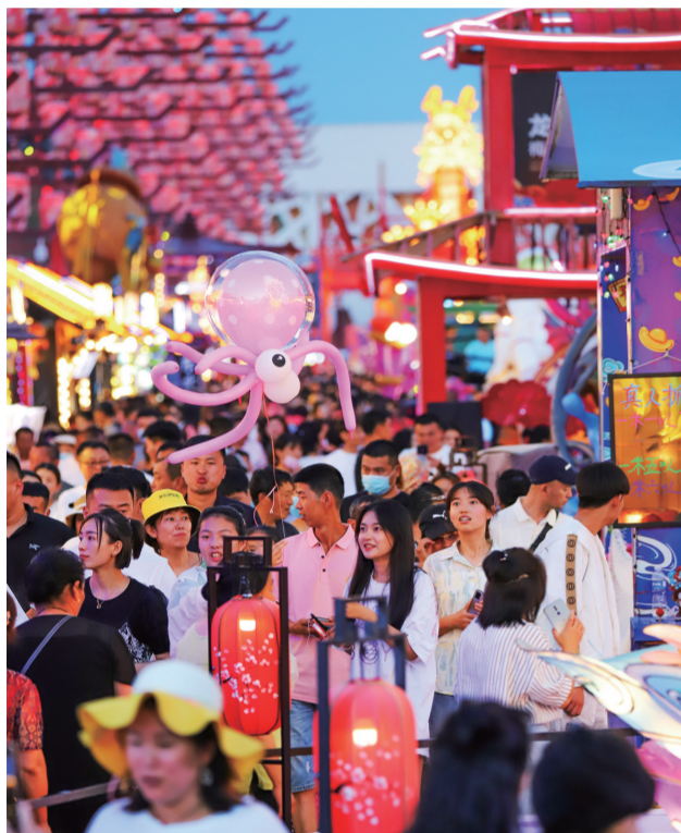
畅游东北不夜城。

这个夏天,梅河口东北不夜城、海龙湖、星光花海、知北村等诸多好玩、好看的景区吸引了来自哈尔滨、辽宁、长春、吉林