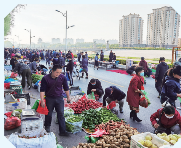
梅河口早市新鲜的果蔬任人挑选采购。本报记者 隋二龙 摄