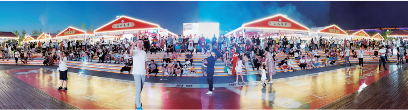
山水广场灯火璀璨。