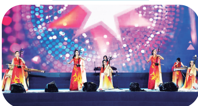
女子十二乐坊现场演出