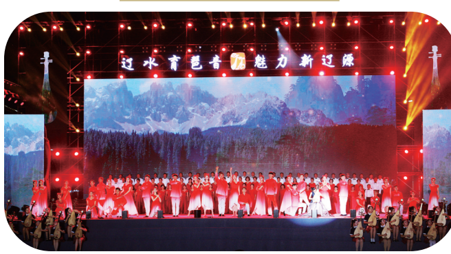
百人琵琶歌舞《唱支山歌给党听》