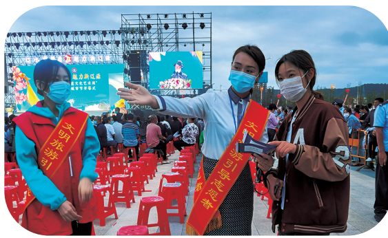
琵琶节现场，志愿服务成为一道靓丽风景

歌舞《美丽辽源我的家》展现了良好的城市面貌和百姓美好的幸福生活；著名艺术家瞿弦和于源春表演的《琵琶行》，气势恢宏，让观众们身临其境；海内外知名音乐团体——女子十二乐坊演奏的曲目向广大市民再次演绎了琵琶文化的精髓；著名艺术家王咏春演唱的歌曲《辽源是我家》唤起了许多游子的思乡之情。