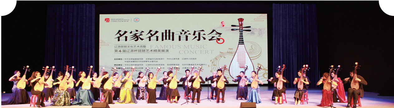
名家名曲音乐会大师合奏《关山三叠》