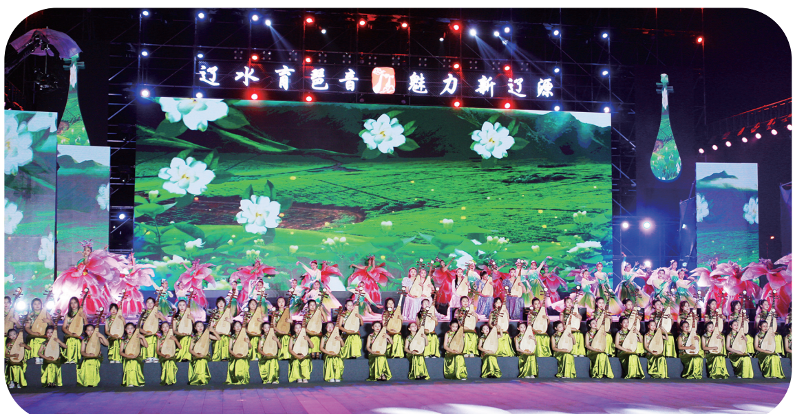
百人琵琶开场舞《茉莉花》