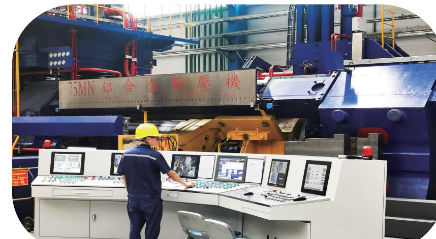
一位操作员正在75MN挤压生产线操作台上工作。

该项目总投资10亿元,项目占地面积9.3万平方米,建筑面积5万平方米,建设厂房4栋。项目拟引进235MN特种挤压生产线、75MN挤压生产线、汽车产品生产流水线、侧墙生产线各1条。