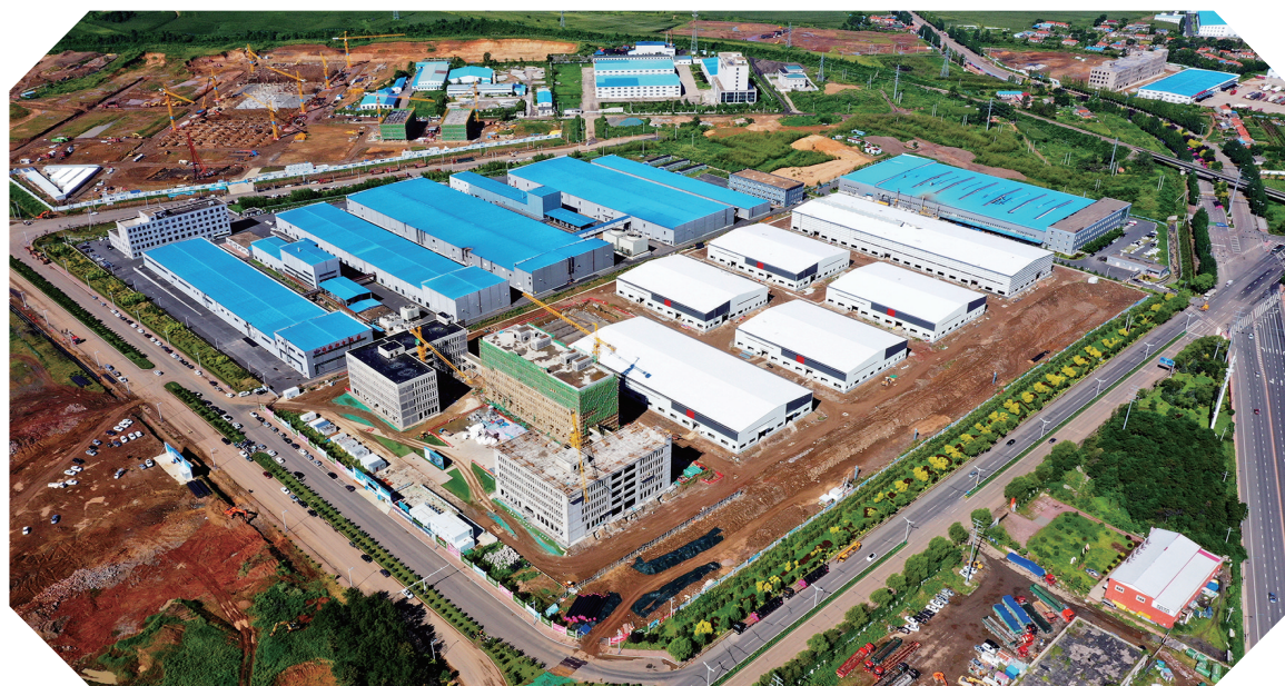
辽源市新能源汽车配套产业园。