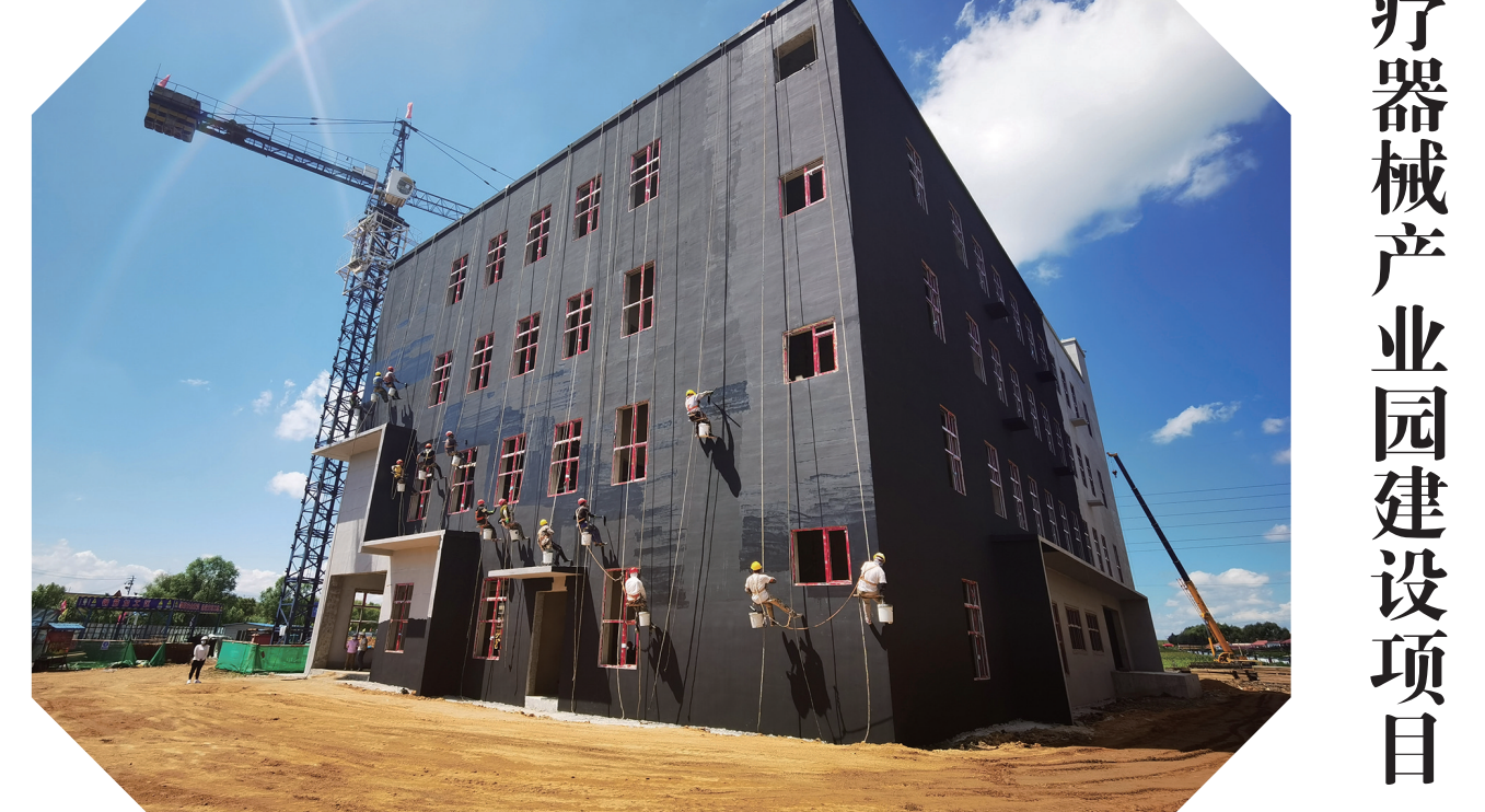
东风医疗器械产业园项目现场,工人在为楼体刷底漆。