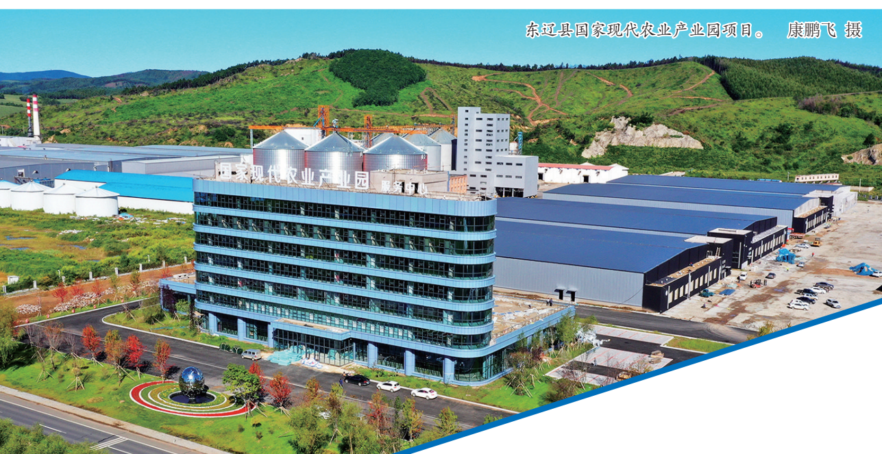
东辽县国家现代农业产业园项目。