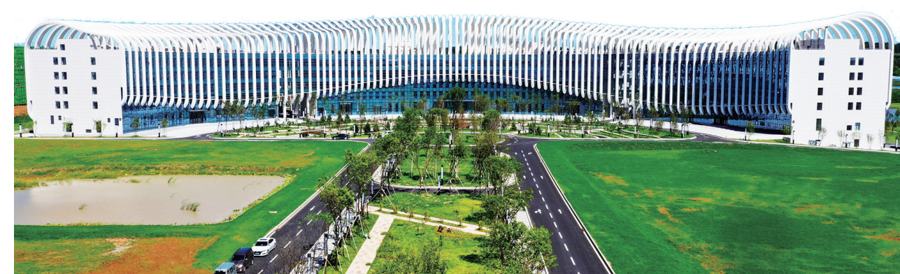
东丰国际梅花鹿产业创投园项目。

项目位于东丰县经济开发区城北工业园,总投资26.22亿元,资金来源为申请专项债及地方自筹。建设规模及主要建设内容:东丰国际梅花鹿产业创投园项目总占地面积53万平方米,总建筑面积52.63万平方米。主要建筑包括5栋产业大厦、12栋标准化厂房、2栋仓储物流、产品展示交易中心、人才服务中心、国际梅花鹿博物馆等。