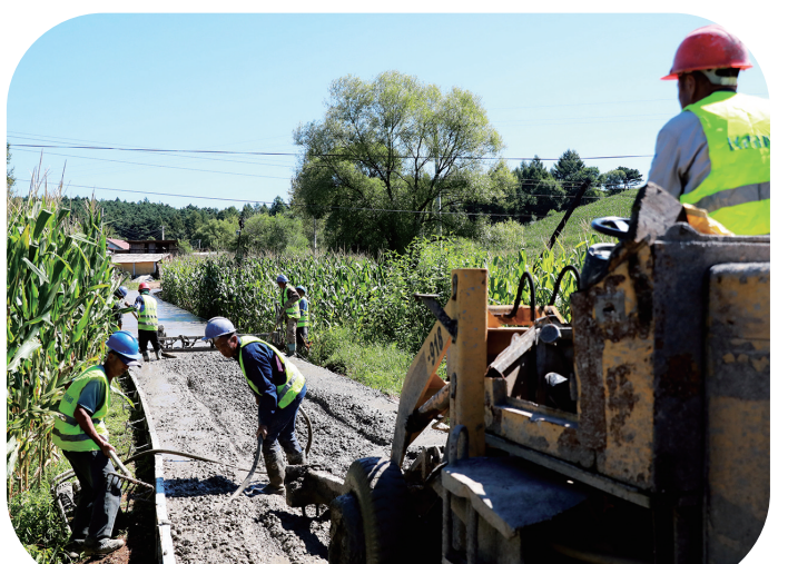
东辽县渭津镇养家村高标准农田建设项目7标段施工项目现场。

2022年辽源市高标准农田建设项目(含东北黑土地保护建设项目):总投资33870万元,建设任务20.8万亩。截至2022年8月底,完成建设任务12.5万亩,总体建设进度达到60%。