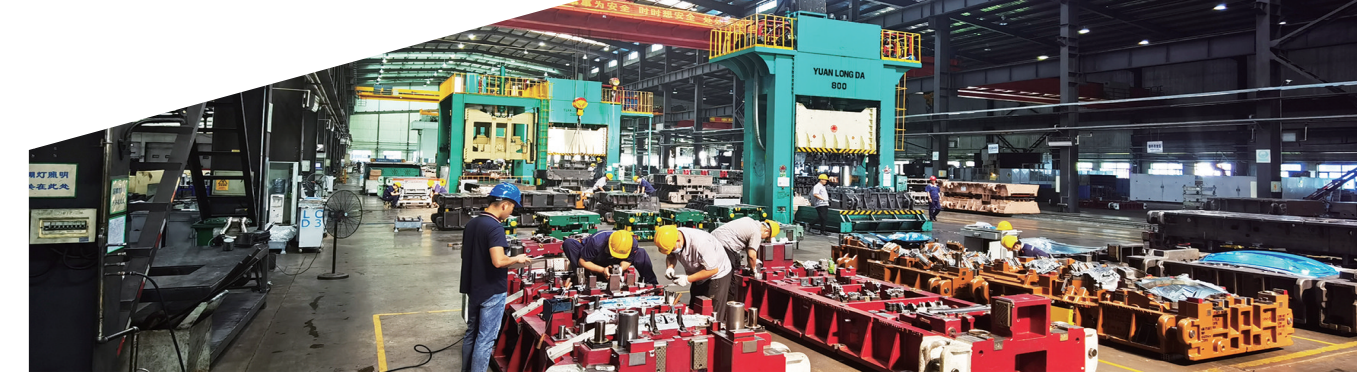
格致汽车的生产车间。

该项目总投资2.5亿元,项目充分利用原有土地、原有厂房及附属设施,购置研发、检测、加工、试制及辅助等设备71台(套),进行智能汽车轻量化模具的开发与研制。项目建成后,年可承接600套智能汽车模具开发、设计及试制任务。年可实现销售收入33500万元,利润总额5963万元,上缴税金3688万元。