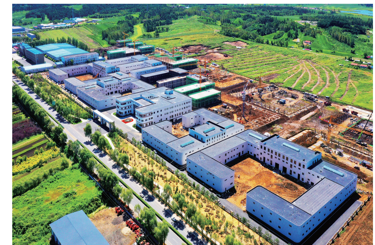
中国·吉浙东丰松籽产业园项目。

产业园位于东丰县三合乡,占地面积50万平方米,其中,建筑面积51万平方米,总投资20亿元,共分三期实施,主要建设生产加工、仓储物流、电子商务、仓单质押、污水处理、科技研发、质量检测、综合办公、保税仓库十大功能区。随着一期项目已建设完成,目前有多家企业正式签约入驻,年可实现产值7亿元,税金1400万元,带动就业1000余人。待项目全部达产后,年可实现产值20亿元,进出口贸易总额15亿元,税金4200万元,可带动发展红松果林15万亩,带动就业5000余人。