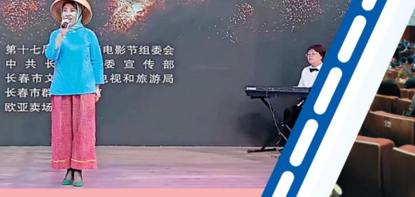
“电影歌曲大家唱”活动现场。

▼2022中国·吉林影视教育与产业发展论坛在吉林动画学院举行。图为论坛现场。