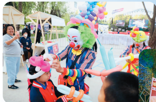
嘉年华现场。

计的光影隧道,回顾历届届中国长春电影节获奖影片,感受中国长春电影节的过去、现在;在电影沉浸式体验区,身临片场感受“导演”的魅力,通过拟音道具感受配音的乐趣;手捧“金鹿奖杯”感受站上领奖台的高光瞬间;在怀旧集市区,一本小人书、一张老胶片、一台旧相机、一件小玩具、一台黑白电视……把你带回那个温暖的年代;在汽车电影放映区,30辆红旗轿车以“30”的造型摆放,坐在轿车内观看电影,感受不一样的观影体验;在经典电影歌曲演绎区,三家长春本土乐队用音乐点燃现场,用最经典的电影歌曲带领现场观众走向节日狂欢。