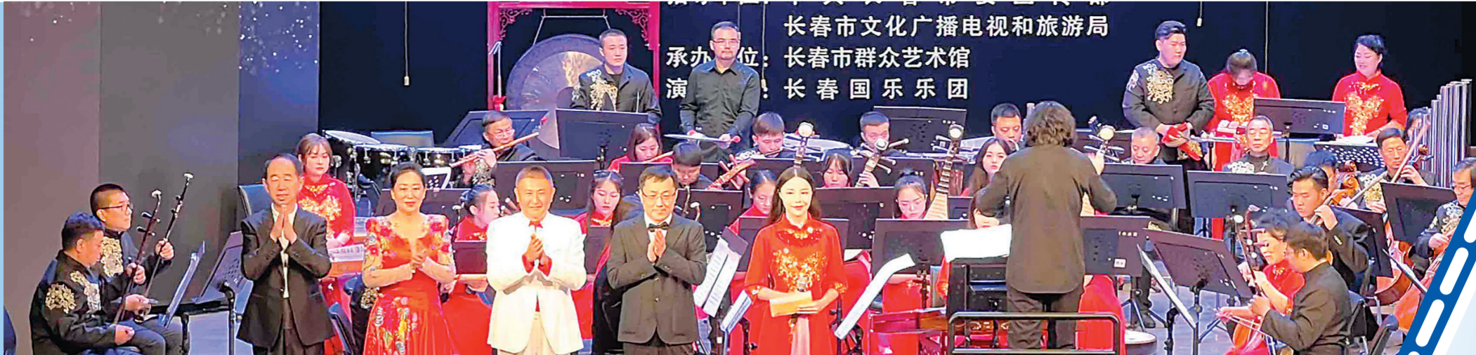
电影主题音乐会现场。

金秋时节,美丽的长春正与丰富的电影元素相约。第十七届中国长春电影节于8月23日至28日举行,群众文化系列活动是本届电影节主体活动之一。通过精彩纷呈的演出,提升了市民对电影节的知晓率和参与率,进一步增强了群众的自豪感、获得感和幸福感,为中国电影“从摇篮再出发”凝聚力量。