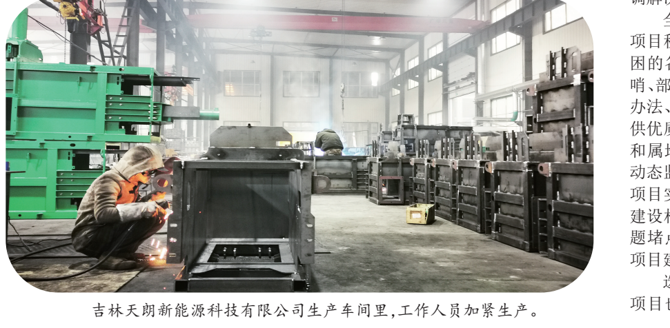
吉林天朗新能源科技有限公司生产车间里,工作人员加紧生产。