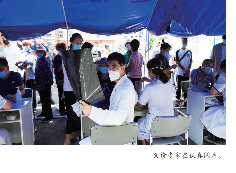
义诊专家在认真阅片。

让很多不方便到外地看病的老人,在家门口就能接受专家的诊治,为大家带来不少福利。“刚就诊结束的患者们欣喜地告诉记者:在与专家沟通的过程中,她学到了很多医学知识,希望长白山每年都能举办这样的义诊活动。”