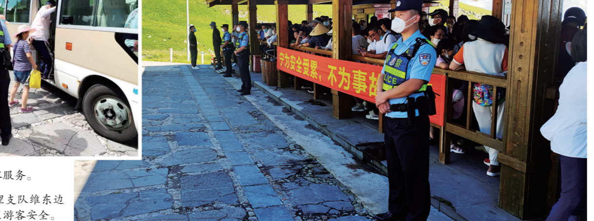
一长白山边境管理支队维东边境检查站民警守护景区游客安全。