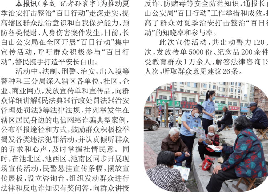
宣传人员与群众强调知法守法的重要性,提醒群众谨防电信诈骗。

本报讯(李成 记者孙寰宇)为推动夏季治安打击整治“百日行动”走深走实,提高辖区群众法治意识和自我保护能力,预防各类侵权、人身伤害案件发生,日前,长白山公安局在全区开展“百日行动”集中宣传活动,呼吁群众积极参与“百日行动”,警民携手打造平安长白山。