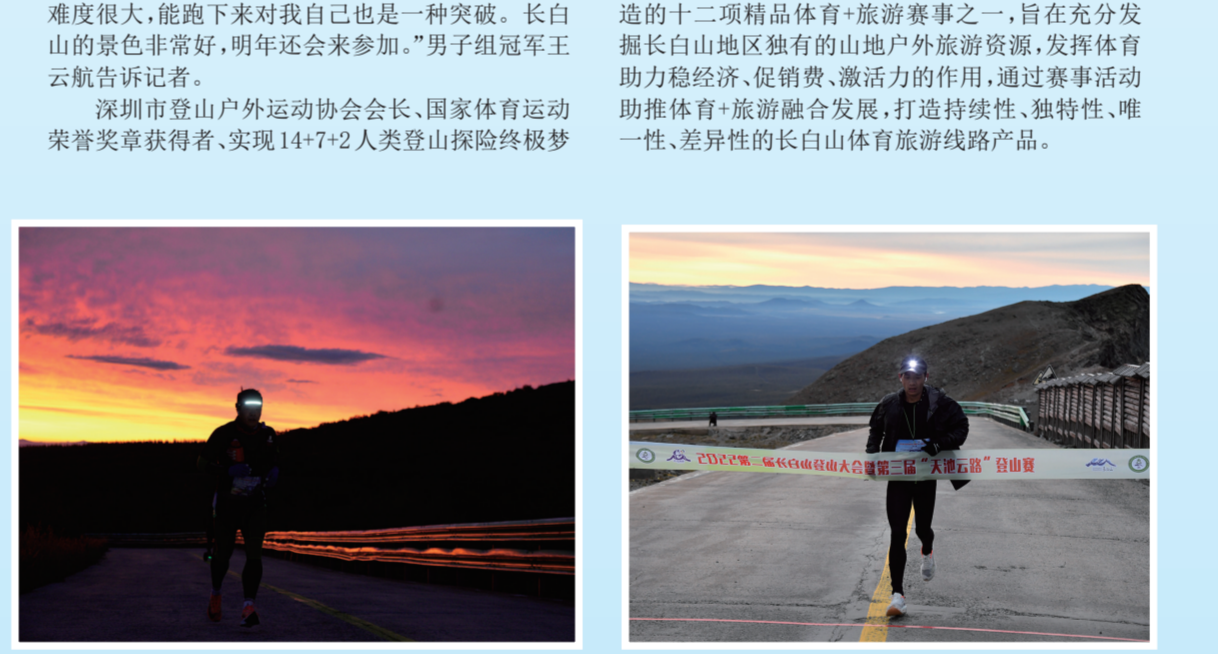
选手向全程10公里、海拔跨度逾1000米的赛道发起冲击。

本报讯(李少元 周凯 张楠 记者孙寰宇)9月4日凌晨4时15分,第二届“天池云路”登山赛在运动健儿们枪炮声中,来自国内共计150余名选手向全程10公里、海拔跨度逾1000米的赛道发起冲击,目标直指长白山天文峰顶。