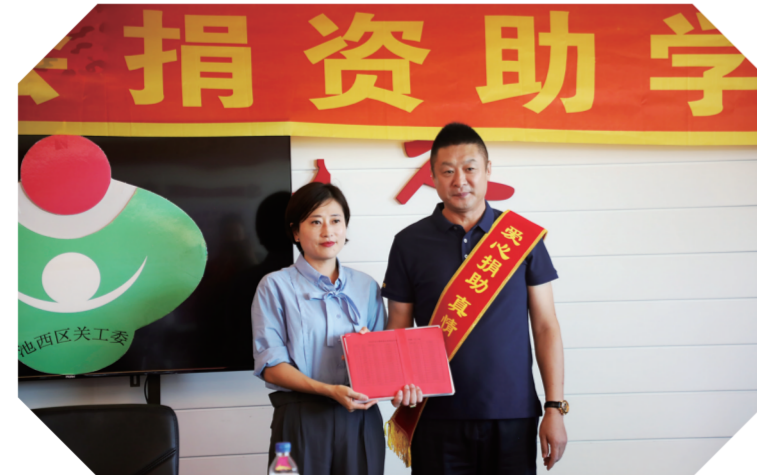
爱心助学,情满池西。

规范村(居)民委员会换届选举,改进网络化管理服务等十项举措,不断健全基层群众自治制度,充分尊重群众意愿,鼓励引导群众自我管理、自我教育、自我服务、自我监督,让人民群众成为基层治理工作的主人翁。