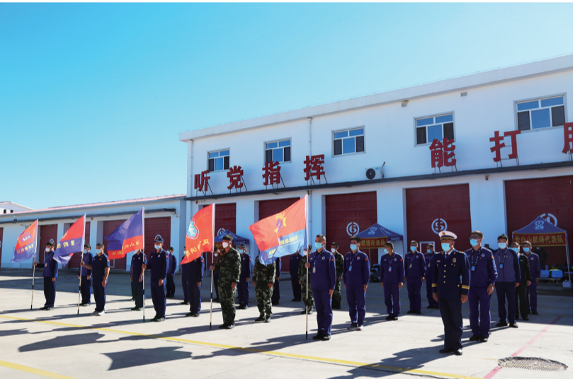
2022年度吉林机场消防职业技能竞赛在长白山举行。