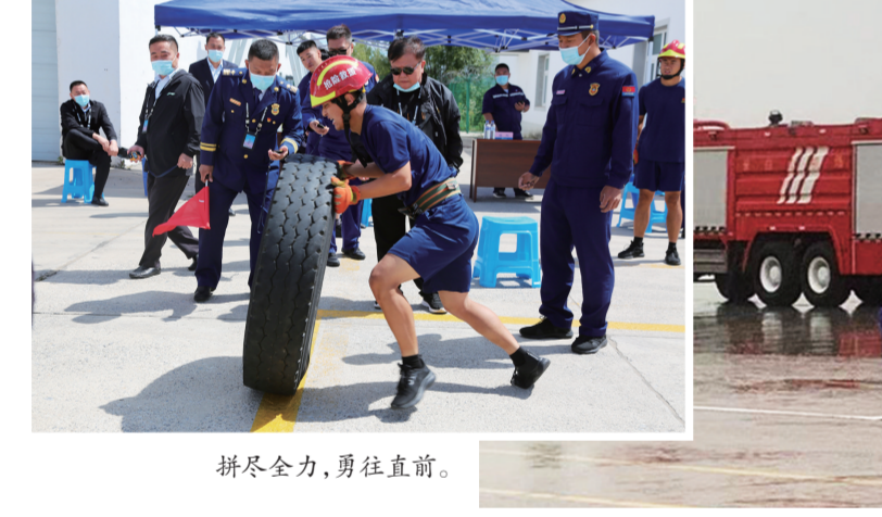
拼尽全力,勇往直前。