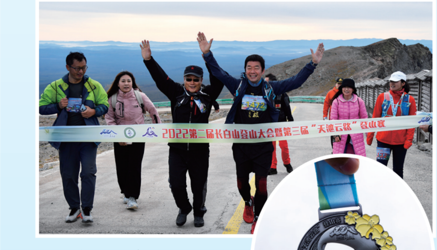
选手们一起冲过终点。