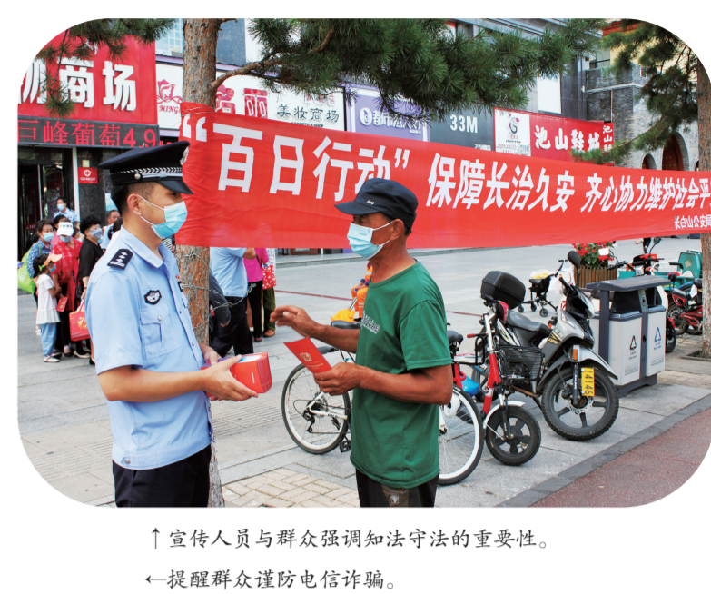
宣传人员与群众强调知法守法的重要性,提醒群众谨防电信诈骗。