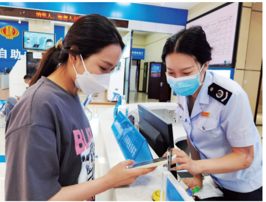
工作人员细心为群众讲解留抵退税政策。

本报讯(陈明 记者孙寰宇)今年国家实施大规模增值税留抵退税政策,力度不断加大,覆盖面不断扩围。