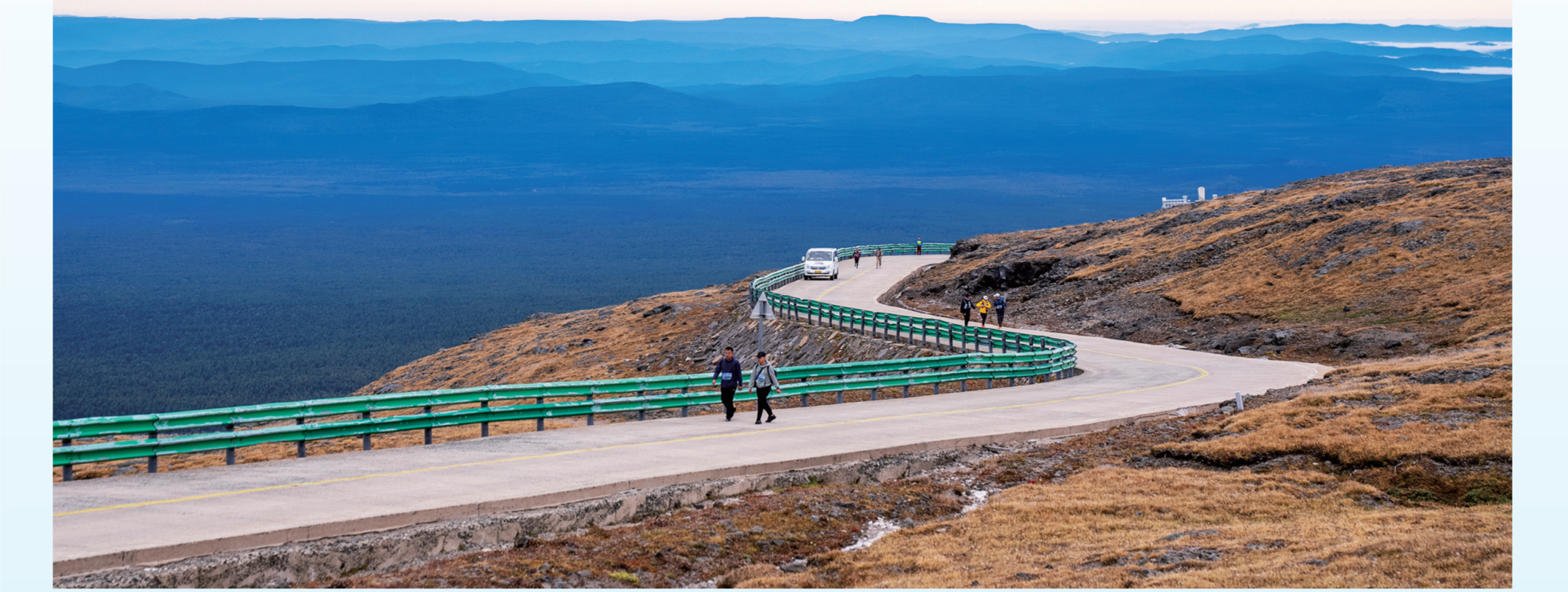
选手们在盘山路上向终点进发。