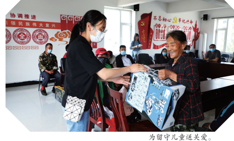
为留守儿童送关爱。