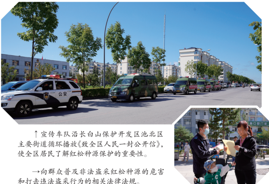
宣传车队沿长白山保护区池北区主要街道循环播放《致全区人民一封公开信》,使全区居民了解红松种源保护的重要性。

本报讯(周凯 记者孙寰宇)进入秋季,为全面加强长白山保护区资源保护和森林防火工作,有效预防和严厉打击各类破坏森林资源行为,提升群众对自然资源的保护意识,普及生态保护知识,8月31日,长白山自然保护管理中心联合