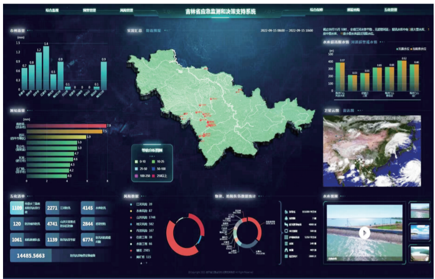
省应急监测和决策支持系统

两年来,省应急管理厅跨前一步,主动担当,运用微观具体指导“六个步骤”落实“五化”闭环工作法,牵头制定农村道路交通、建筑施工两个模板集,成功破解了应急管理部门综合监管难以介入行业部门直接监管的问题。今年以来,全省道路