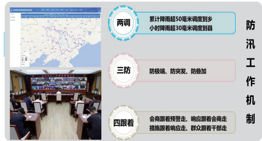
科学高效的防汛工作机制

第四个特点,信息化是实现“五化”的重要支撑。清单、图表、手册、模板、机制的制定落实和实时更新离不开高科技的信息化手段。省应急管理厅建立了应急管理“五化”信息管理系统,把所有清单、图表、手册、模板、机制全部录入系统,全过程扫描、全链条联动、全闭环管理、全方位落实,实现了进度上报、过程留痕、动