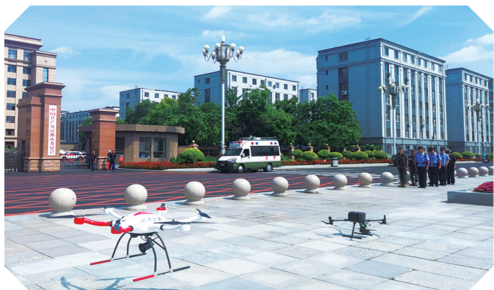
“无人机+”联动巡控“空地智慧警务”巡逻模式。

“百日行动”开展以来，结合夏季多发警情实际，辽源巡特警支队精心谋划，统筹编组创建“战训”新模式。为落实高等级联动工作任务，实地踏查“五条美食街、四大重点党政机关、三个中心广场、二个重点车站”，并以此为巡控中心全覆盖向“重点部位、重要设施、人员密集场所、易发高发案区域时段”，有力推进工作方式由基础的“机动车巡、步巡”向“无人机+”转换提升。