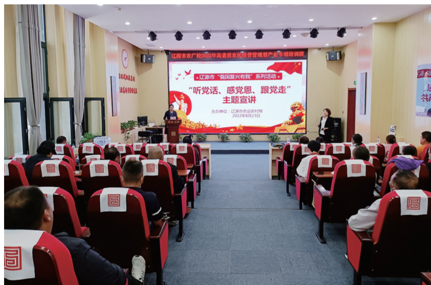
汲取智慧，汇聚力量。

传承红色基因、赓续红色血脉。今年清明节期间，辽源市委宣传部分组织开展了清明节网上祭扫活动，全市70000多名机关干部和群众和青少年通过线上祭扫瞻仰烈士，敬献花篮，传承中华优秀传统文化，弘扬爱国主义精神，激发全市人民的爱国热情，凝聚奋进新时代的磅礴力量。