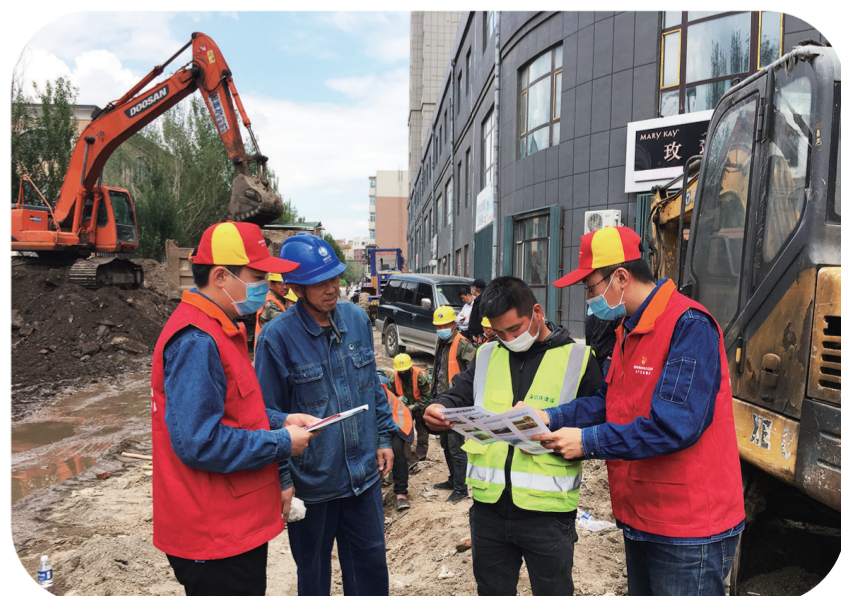
9月16日，国网辽源供电公司西安台区供电中心党员服务队队员来到西安台区的家园小区作业施工现场，向施工人员告知电缆走向，宣传防外力破坏知识。

在防外力破坏宣传活动中，发放《电力设施保护条例》《电力线路外力破坏案例警示图册》等材料，为群众讲解