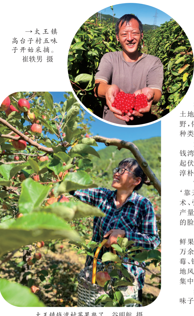
一大王镇高台子村五味子开始采摘。