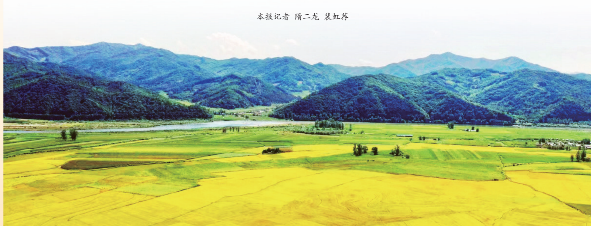
俯瞰金色稻田。本报记者 隋二龙 裴虹苻

本报记者 隋二龙 裴虹苻 目前，正是稻菽丰稔、瓜果飘香的时节，行走在通化县的田间地头，玉米、水稻等各类农作物长势喜人，农民们忙碌不停，处处皆是好“丰景”。 来到通化县大泉源乡新农村，千亩玉米地阡陌纵横，成熟后的鲜食玉米茎秆粗壮，籽粒饱满。 “鲜食玉米收获期比大田玉米提前一个月，收完这批再去收大地玉米一点不耽误。今年，我们种的鲜食玉米品种是‘万糯’，每亩达3000斤没问题，又是一个丰收年！”金秋收获忙，新农村村民卢志伟喜笑颜开。 据了解，通化县自1998年开始种植鲜食玉米，目前种植面积达10万亩，年产鲜食玉米3亿穗以上，带动1.5万个种植户每年增收5000万元。 满载着丰收的喜悦，通化县西 镇的万亩稻田金黄摇曳。再过几天，这里的稻米就要走进千家万户。 近年来，西江镇立足资源禀赋及特色优势，高标准定位，聚力打造“梦里水乡·贡米小镇”旅游品牌，在积极践行“绿水青山就是金山银山”理论中，注重构建文化旅游格局，深入推动农旅融合发展，实现了生态效益、经济效益“双丰收”。依托通化江达米业、西江米业等5家企业，建成西江贡米绿色有机循环生态农业示范区，园区内优质水稻经营面积2.3万亩，认证绿色水稻1.4万亩，推广稻田养鸭0.44万亩，稻米行业年产值达2.05亿元。 据了解，2022年通化县农作物播种面积172.35万亩，全县耕、种、收综合机械化水平达80.19%，预计粮食总产量达3.7亿斤。