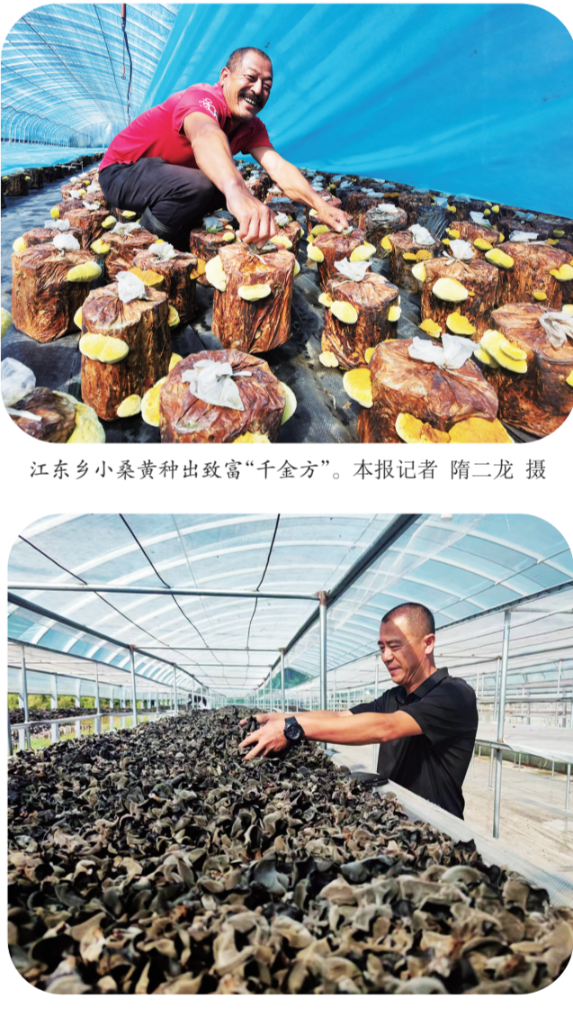
江东乡小桑黄种出致富“千金方”。