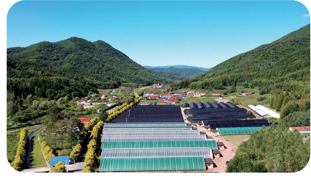
致富棚，丰收景。本报记者 隋二龙 裴虹苻

赵家 本报记者 隋二龙 裴虹苻 够给力，村民底气足。借助通化“中国医药城”的品牌效应发展药材种植，江东乡横道子村依托优势自然资源发展乡村旅游，拿出“咬定青山不放松”的精神，推动实现产业强村。 漫步村中，映入眼帘的是一排排整齐划一的桑黄种植大棚，棚内满地桑黄像花朵一般绽放。今年，村里继续扩大种植规模，已累计投入资金500余万元，发展桑黄栽培大棚52个，菌棒达27万余棒。同时，科学规避风险，采取“企业+集体+农户”的产业运营模式，“订单式”生产桑黄，打消销售后顾之忧之忧。不断延伸产业链条，开发桑黄观光，搭建观景平台和产品展示厅，短期内已吸引千余名高端客户群体游览并下单。 产业发展是村民致富增收的核心，产业