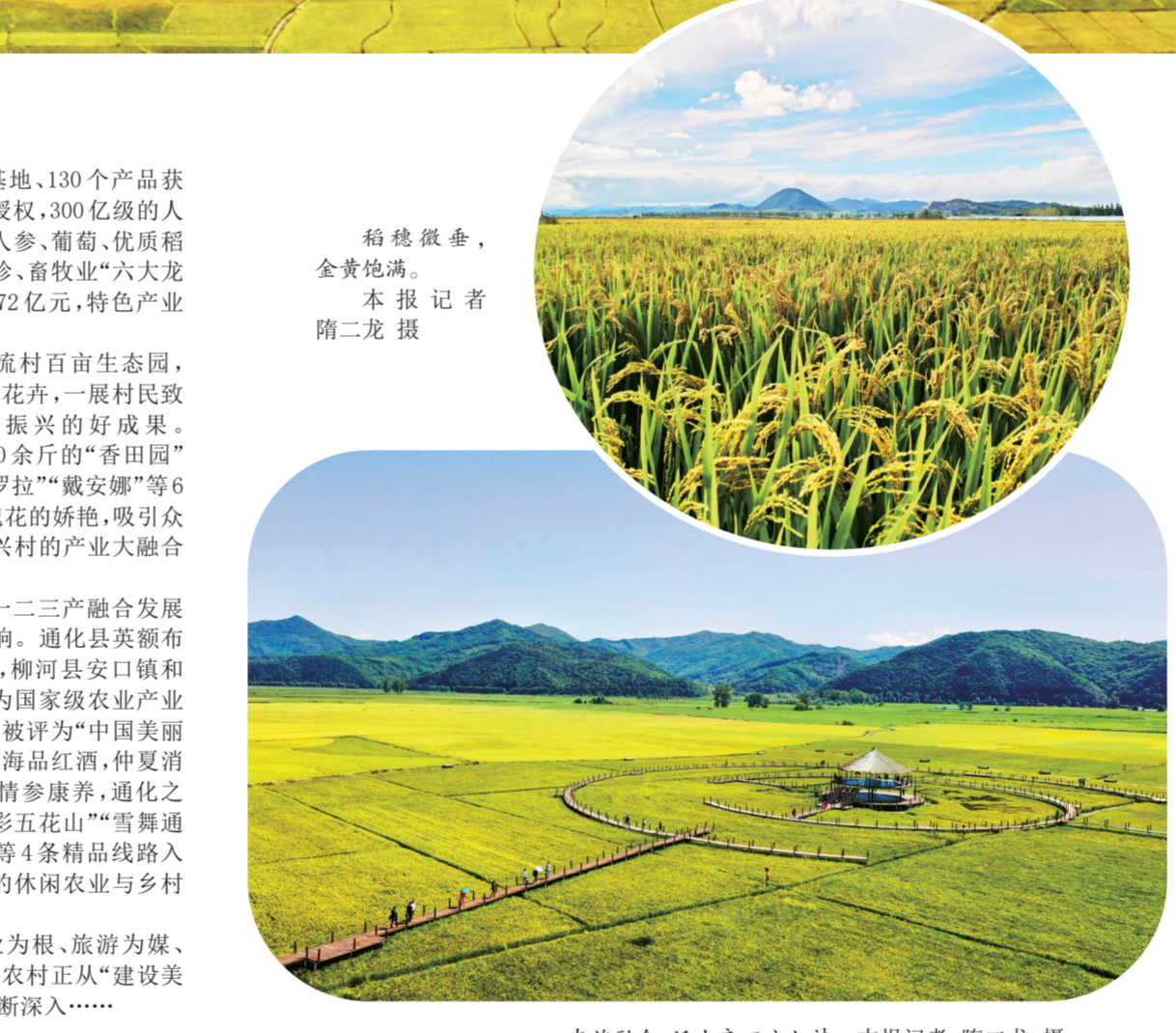
农旅融合，沃土良田亦如诗。本报记者 隋二龙 裴虹苻

俯瞰金色稻田。本报记者 隋二龙 裴虹苻 春种一粒粟，秋收万颗子。农历秋分即将到来之际，稻田金黄，瓜果飘香。伴着第5个中国农民丰收节来临，通化大地沉浸在丰收的喜悦里。 这个属于农民自己的节日，正逐渐成为中华农耕文明的鲜明符号，既是新时代重农强农的生动象征，也是透过火热丰收画卷望向乡村振兴图景的一个窗口。 探访通化市各水稻基地，稻浪滚滚，片片金黄，沐浴着暖阳微风，一处处优质水稻正陆续开镰。 看！通化黑土地上正书写着“优粮”答卷。210.73万亩粮食生产功能区和2万亩重要农产品保护区“两区”建立工作已通过国家初步审核验收，全市连续5年来粮食产量稳定在27亿斤左右，市委、市政府用粮食稳增产的“军令状”，丰盈保障人民群众的“饭碗”。 走进集安益盛汉参产业园，红参精提口服液、纯汉参膏等人参精深加工产品正全速生产。园区致力于人参全株开发，形成了上游种植、中游加工、下游销售服务的完整产业链。 看！通化农特产业疾驰在结构优化的“快车道”上，“人参花”增选为通