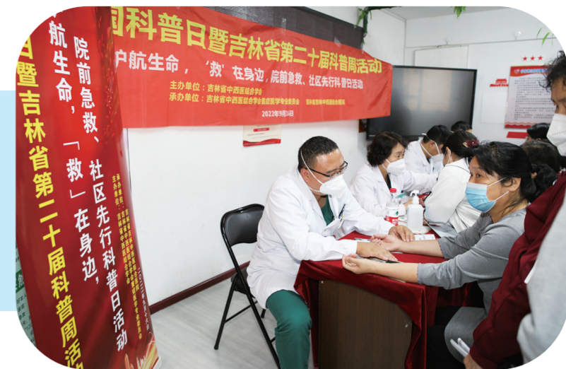
省中西医结合学会开展“护航生命·救在身边”院前急救科普活动