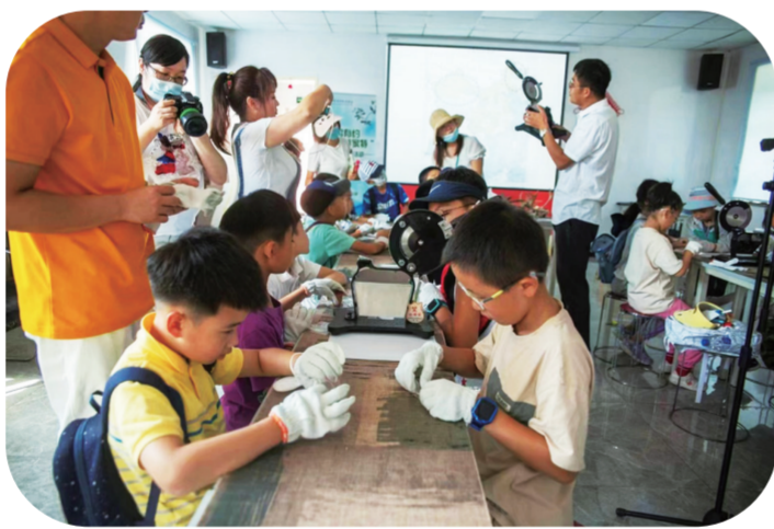
省特产学会开展“鹿鸣有约,畅游家特”主题科普活动