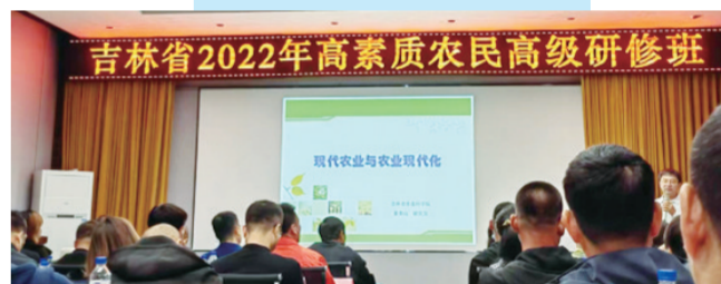
省农业农村厅举办吉林省2022年高素质农民高级研修班