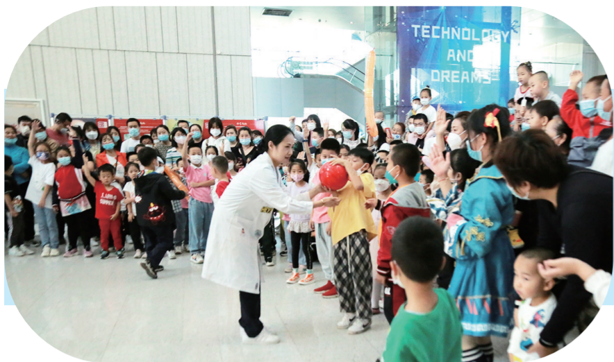
省科技馆举办科学实验表演活动受到小朋友的广泛欢迎