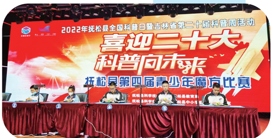
抚松县科协科普日期间举办抚松县第四届青少年魔方比赛