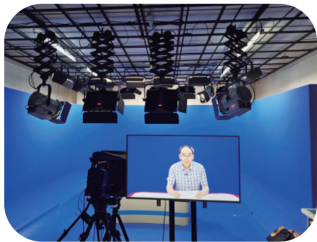
医疗专家正在吉林教育电视台直播间为受众普及健康科普知识