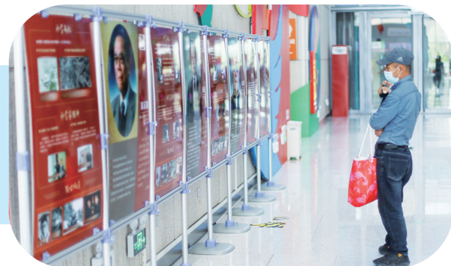
省科协在省科技馆举办“科学人生·百年”院士风采展感染和激励着参观者