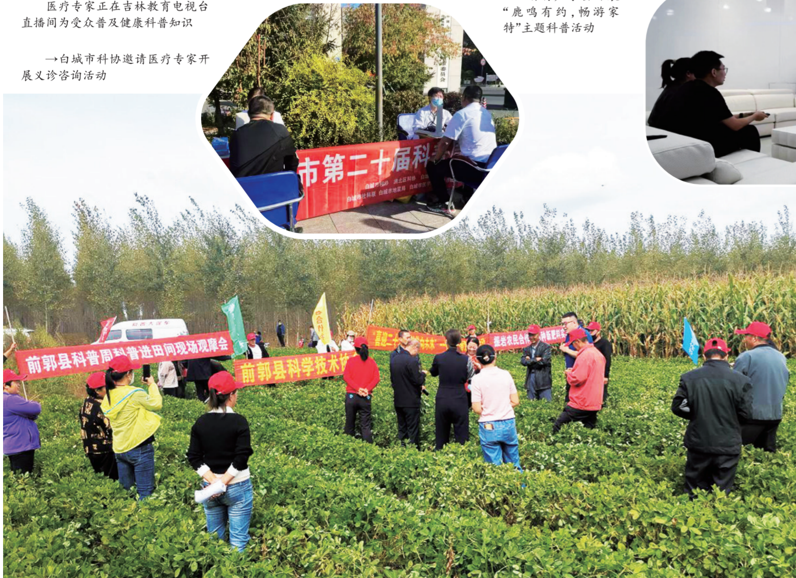
前郭县科协开展科普进田间观摩活动