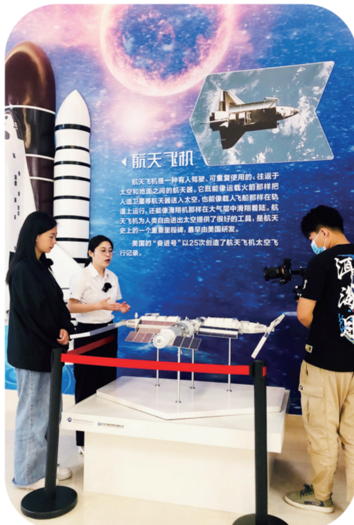
省科协举办的“云游”科普教育基地活动得到网友们的关注