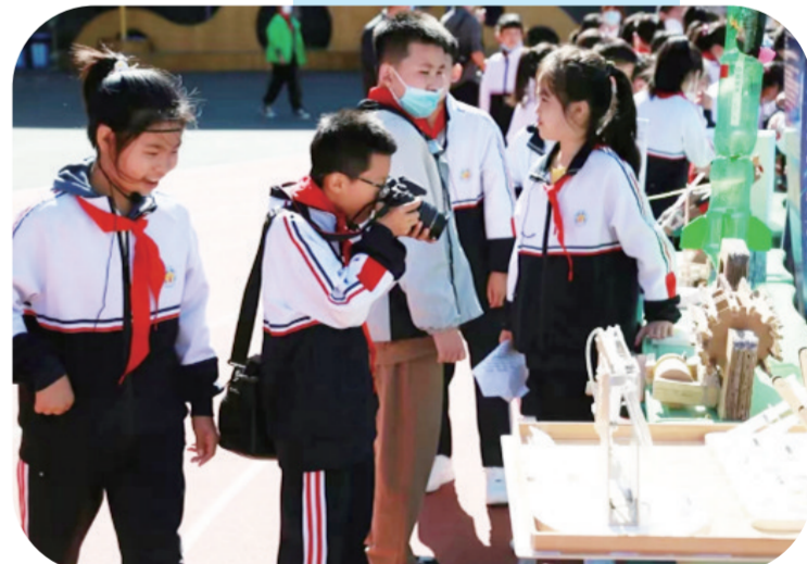
在吉林市第一实验小学举办的吉林省青少年科学节活动吸引孩子们动手实践