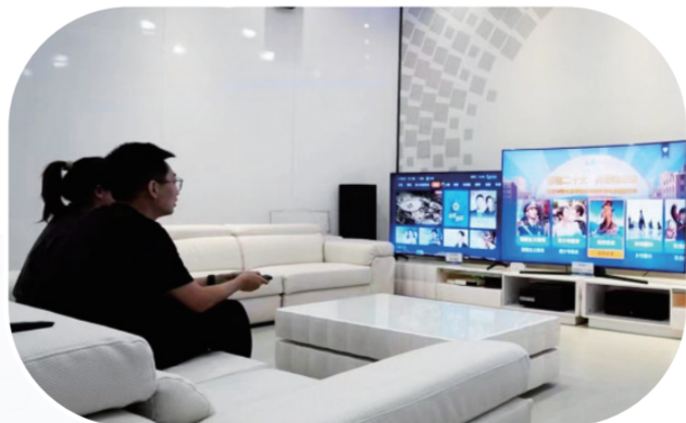
公众居家欣赏影视传媒“科普中国”电视频道科普电影展播