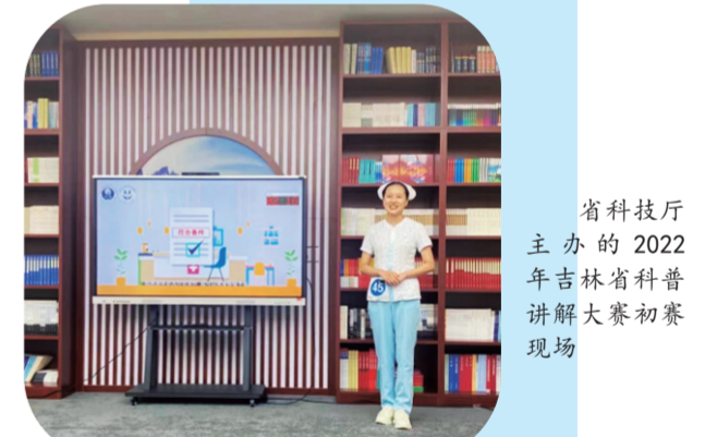
省科技厅主办的2022年吉林省科普讲解大赛初赛现场