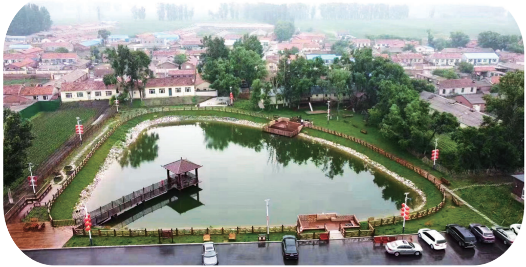
绿园区西新镇裴家村现代都市农业旅游观光园晟裕池塘。