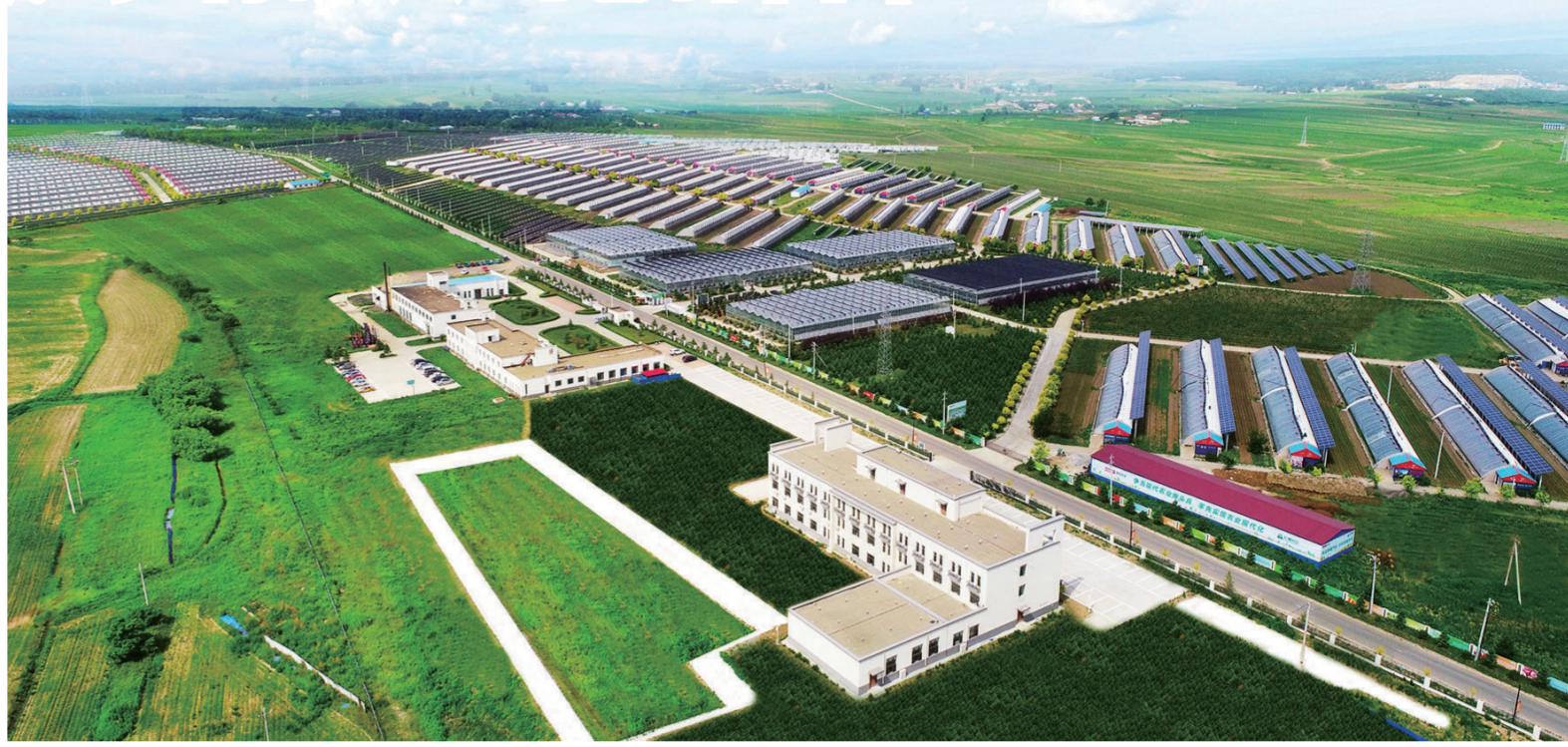
双阳区国信现代农业项目积极探索集约、高效、安全、持续的现代农业发展道路。

金秋九月,正当玉米、水稻等粮食作物还在生长时,长春市广阔的田野里有一大批园艺特产迎来丰收,成为秋日里一道别样风景。从过