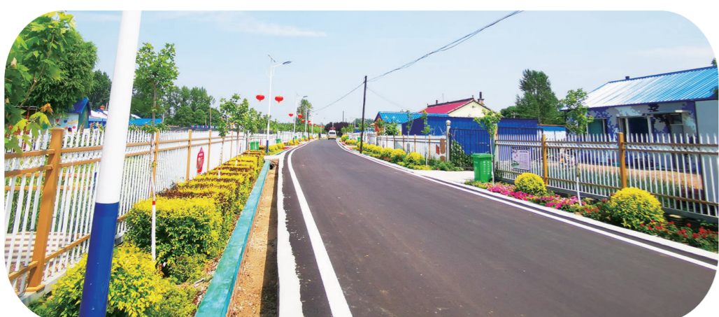
九台区波泥河街道清水村整洁的人居环境。

今年,长春市落实粮食作物播种面积2457.39万亩,超过任务指标40.69万亩,比上年增加103.71万亩。以非常之举,应对非常之事。一声号令,一辆辆满载农资的运输车开进村口;一队队返乡农民回归田园;一项项长春市稳增长的政策措施接续出台,一笔笔种粮补贴及时下发。乡、村两级干部与农户结对包保,“一户一策”帮扶政策温暖民心,合作社、农机大户“代耕代种”与小农户实现互动。