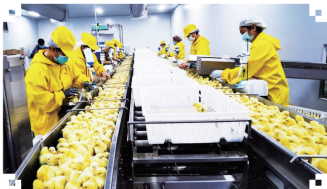
2021年,位于德惠市的德翔集团全产业链销售收入近30亿元,固定资产达20亿元,年孵化鸡雏1亿只,实现以产业助力乡村振兴。

今年以来,长春市紧紧围绕乡村振兴战略和率先实现农业现代化的总目标,进一步做大“蔬菜、花卉苗木、瓜果、食用菌、特色经济作物”五大园艺特产主导产业,做强“六带一区”,即长双、长九、长九榆、长德榆、长农、长怀特色农业