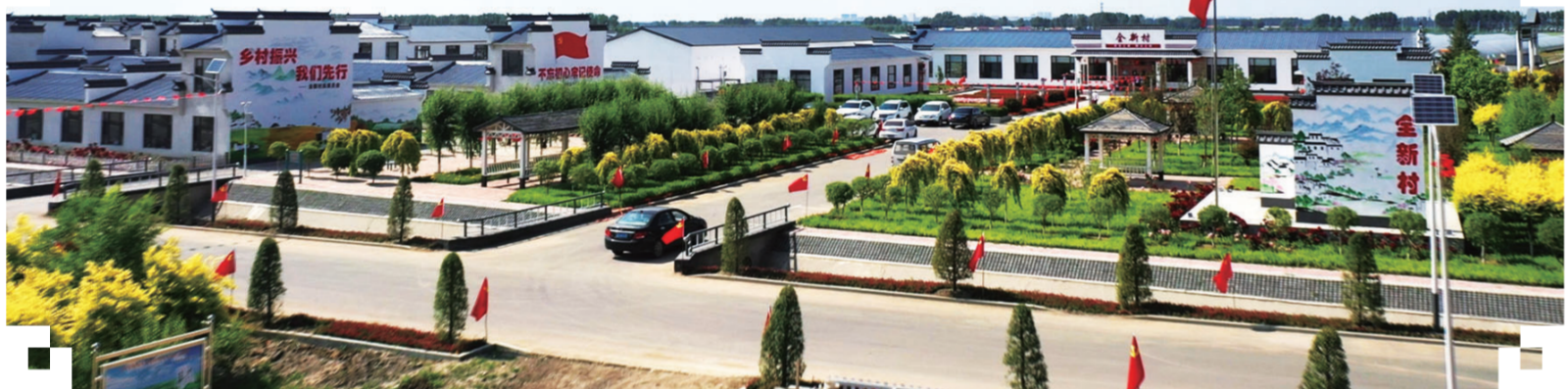
农安县全新村持续推进人居环境提升。

做强农产品精深加工,三产融合推进农业高质量发展。九台区龙嘉街道红光村的268公顷高标准农田现代农业示范园区,水稻正茁壮生长。“合十农业”的大米订单纷至沓来。以农业种植、加工为基础,文化教育、旅游观光协同发展的三产融合示范园区正在形成,实现了生产、生活、生态效益“三生共赢”。