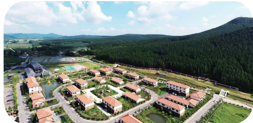
位于九台区土们岭街道马鞍山村的沈逸山居民宿项目为乡村振兴注入动能。

农民富、乡村美。长春正以“奋斗有我、就在吉林”的昂扬姿态,扛起“一主”担当,融入构建“六双”格局,闯新路,开新局,做表率。