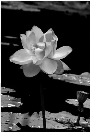
荷池水满静流,树荫照水爱风柔。初秋,琿春荷花别样美。

搬家的路途很遥远,哭累了的我不知道什么时候睡着了。等我醒来时天已经黑了,全身被被子裹得严严实实的,我探着头四处张望,才发现已经在拖拉机上,而是在三姨爷的牛车上。赶车的是父亲,前面并排坐着的是三姨爷和三姨奶,我蜷缩在母亲的腿边,母亲怀里抱着熟睡的妹妹。三姨奶见我醒了,就把我抱在了她