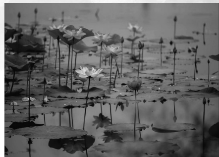
任显臣/文

的怀里。她的怀里软软的,很温暖。路边是一片片稻田,远处能看到星星点点的灯光了。三姨奶慈祥地笑着,她紧紧地抱着我,轻轻地摇晃起来,还唱着歌。我记得那首歌有一句是:“月儿明,风儿静,树叶儿遮窗棂……”实际上,那晚并没有月亮。