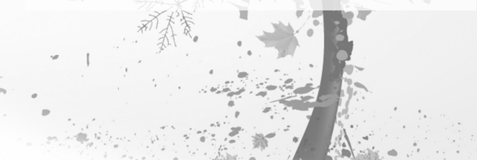
任显臣/文